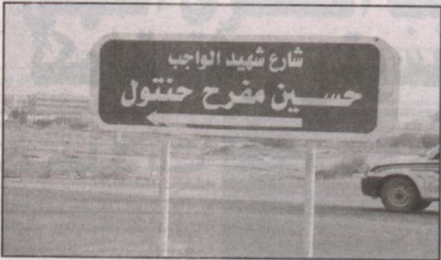
تسمية أحد الشوارع في جازان باسم الشهيد حسين حنتول تخليداً لتفكيره

ولاية الأمر معنا دائماً.. وهذه مناسبة عظيمة لتجديد الولاء والوفاء للقيادة والوطن