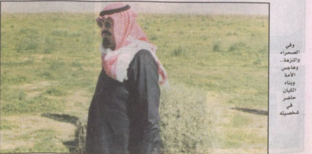
وفي الصحراء والنزهة.. وهاجس الأمة وبناء الكيان حاضر في شخصيته