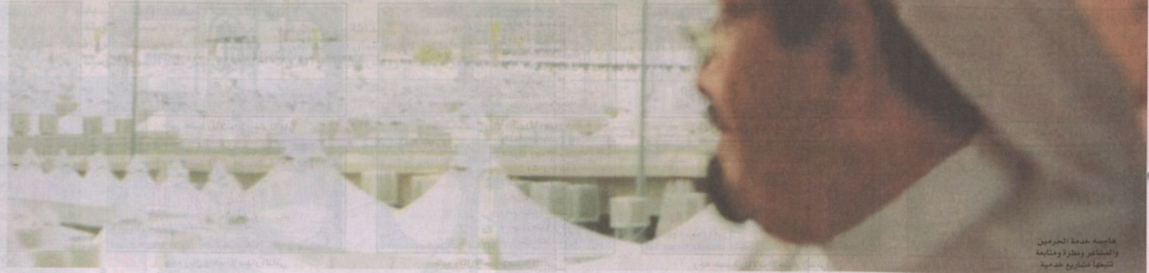
عاجبه خدمة الحرمين والمشاعر ونظرة وعتابة لتبناها مشاريع خدمية

تقاطعات النموذج الشخصي لخدام الحرمين الشريفين مع والده الملك المؤسس