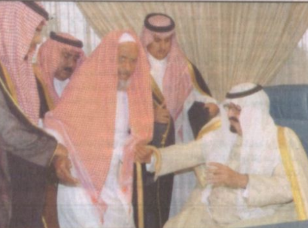
استقبال لجموع المواطنين سفاراً وكباراً برفق وحنو

المتتبع لحياة خادم الحرمين الشريفين الملك عبدالله بن عبدالعزيز السياسية والاجتماعية والخاصة منذ أن كان ولياً للعهد يلحظ بساطة ذلك الرجل الفذ رغم اتصافها بالقيادية والحكمة متبسم.. حان.. جاد.. وعطوف.. محنك.. وقيادي بعدل ووفاء.. ليس مع بني جلدته وشعبه فحسب وإنما تعدت تلك الأريحية والتواضع الكبير إلى خارج حدود الوطن.. تجده مطبقاً للمنهج النبوي الشريف، ان كان في الساقية - كان في الساقية وإن كان في الحراسة كان في الحراسة.. في يوم الوطن يحق لنا أن نتخبر ونرصد سمة شخصية هذا القائد التي يلحظ بها