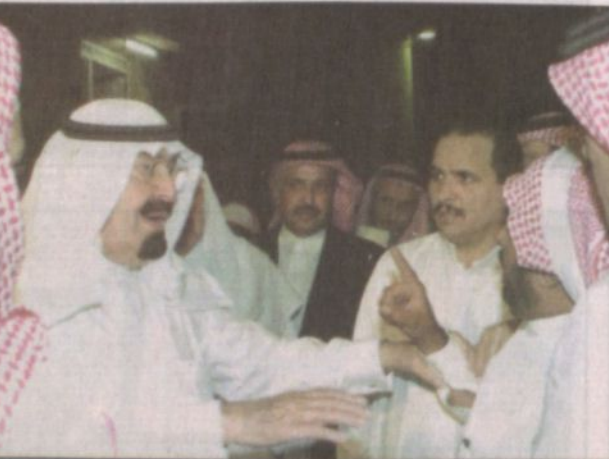
وسماع وعطمانه لأبناء شعبه قولاً وفعلًا