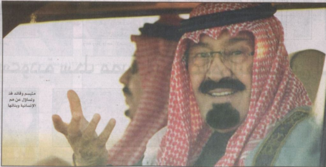
متبسم وقائد فذ وتساؤل من هم الإنسانية وبنائها

متبسم.. قريب من الجميع.. حاضر ومؤثر في جلساته