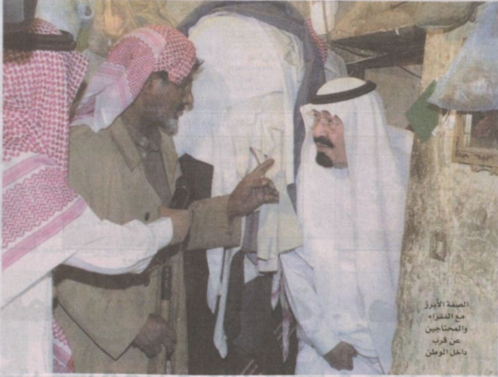
الصفة الأبرز مع الفقراء والمحتاجين من حرب داخل الوطن