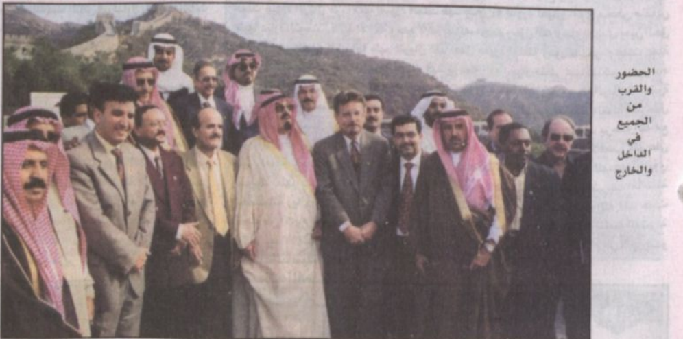
الحضور من الجميع في الداخل والخارج