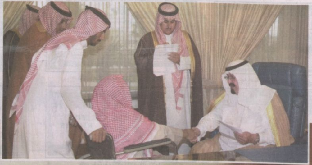
متمسكاً حاجات المواطنين عبر مجلسه كما كان كذلك الملك عبدالعزيز