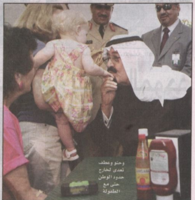
وحنو وعطف تعدي لخارج حدود الوطن حتى مع المملوكة

«الكاريزما» الشخصية للملك عبدالله جعلته رجل كل الفئات والمواقف