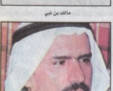
مالك بن نبي

عمر موسى - الشرق الأوسط * إن الإنسان لا يدخل العمليات الاجتماعية كمادة خام بل يدخل في صورة معادلة شخصية صاغها التاريخ وأودع فيها خلاصة تجارب (سابقة)