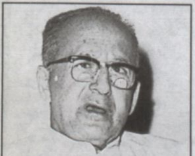
د. عمرو موسى

عبدالرحمن منيف في كتابه «العراق.. هوامس من التاريخ والمقاومة» * لم أعرف العرب إلا في السنوات الخمس الأخيرة.. ومندهش من ميلهم للالتحار