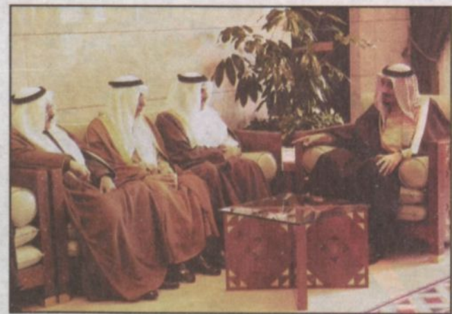
الأمير سلمان خلال استقباله رئيس وأعضاء المجلس البلدي لمدينة الرياض (واس)