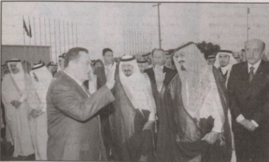
خادم الحرمين في وداع الرئيس المصري