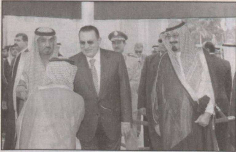
خادم الحرمين يستقبل الرئيس مبارك لدى وصوله جدة.. (واس)