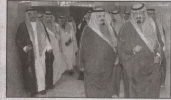
خادم الحرمين لدى مغادرته الرياض