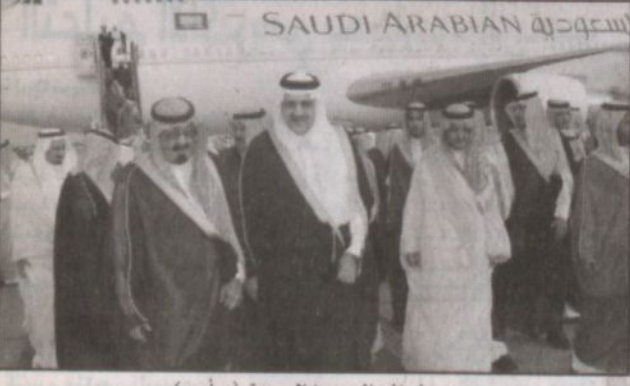
وصول خادم الحرمين إلى جدة.. (و.أ.س)

جدة - واس، عقد خادم الحرمين الشريفين الملك عبدالله بن عبدالعزيز آل سعود حفظه الله وأخوه فخامة الرئيس محمد حسني مبارك رئيس جمهورية مصر العربية الشقيقة اجتماعاً أمس في صالة التشرifications بمطار الملك عبدالعزيز الدولي بجهة. وعلى الساعة العربية وفي مقدمتها تطورات القضية الفلسطينية والوضع في العراق. كما جرى استعراض تطورات الأحداث على الساحتين الإسلامية والدولية وموقف البلدين الشقيقين منها إضافة إلى اتفاق التعاون بين البلدين وسبل دعمها وتعزيزها في جميع المجالات بما يقدم مصالح البلدين والشعبين الشقيقين. حضر الاجتماع من الجانب السعودي صاحب السمو الملكي الأمير سلطان بن