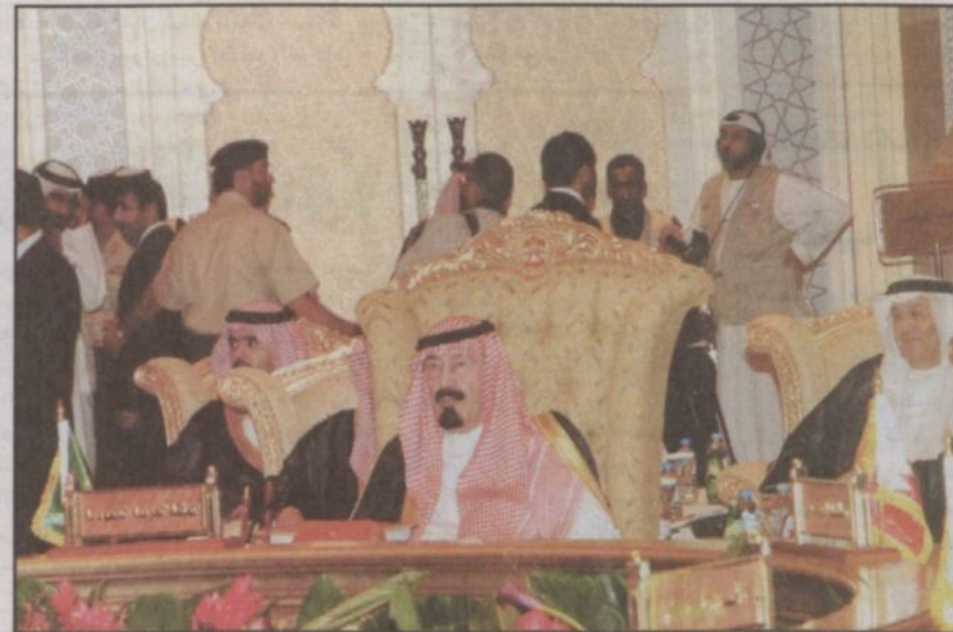
خادم الحرمين مترسلاً وفد المملكة في الجلسة الافتتاحية لقمة (الملك فهد) بأبوظبي (و.ا.س)

أرحب بكم أجمل ترحيب في بلدكم الثاني دولة الإمارات العربية المتحدة وفي عاصمتها أبوظبي التي تشرفت بولادة مجلس التعاون على أرضها قبل ربع قرن من الزمان. إننا أيها الأخوة ونحن في غمرة الاحتفال بهذا الانجاز الخليجي الكبير فإنتنا لا ننسى أن نرفع أيدينا