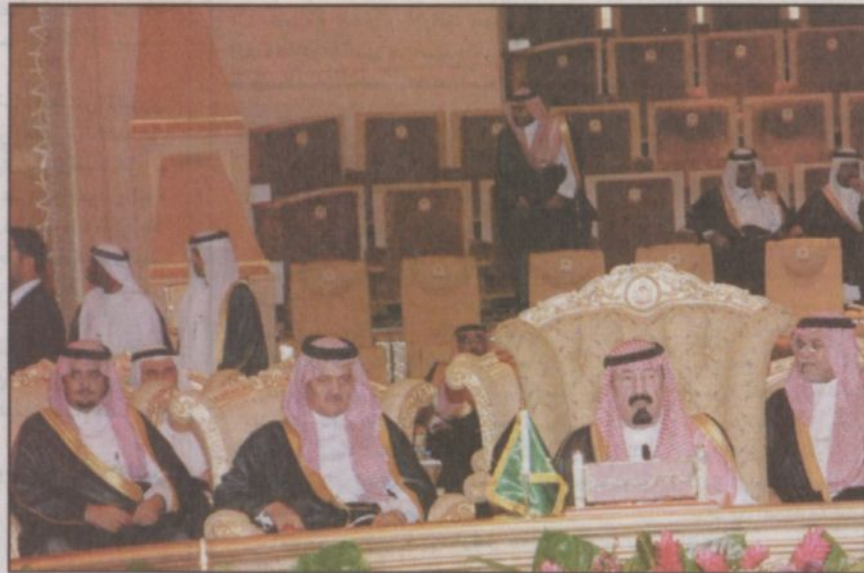
خادم الحرمين مترسلاً وفد المملكة في الجلسة الافتتاحية لقمة (الملك فهد) بأبوظبي

أبو ظبي - علي القحبيص، بدأ أصحاب الجلالة والسمو قادة دول مجلس التعاون لدول الخليج العربية مساء أمس الجلسة الافتتاحية لاجتماعات الدورة السادسة والعشرين للمجلس الأعلى لمجلس التعاون (قمة الملك فهد) التي تستضيفها دولة الإمارات العربية المتحدة. وبدأت الجلسة الافتتاحية لقمة مجلس التعاون التي عقدت بقصر الإمارات بأبوظبي بتلاوة من آيات الذكر الحكيم.. ثم ألقى صاحب السمو الشيخ خليفة بن زايد آل نهيان رئيس دولة الإمارات العربية المتحدة كلمة رحب فيها بأخوانه أصحاب الجلالة والسمو قادة دول مجلس التعاون الخليجي. ونوه سموه بأن ما حققته مسيرة المجلس على مدى خمسة وعشرين عاماً يدعو إلى الفخر والاعتزاز.. مؤكداً أن ما يجمع بين دول المجلس وشعوبها من مودة وتقارب وتعاون وكثيف بأن يزيد من صلابة البيت الخليجي الواحد. وأضاف بأن ما تحقق من إنجازات قد لا يصل إلى طموحاتنا وتوقعات شعوبنا التي تطالب بتسريع الخطى للوصول إلى الأهداف التي وضعناها. وقال سمو الشيخ خليفة بن زايد إن دول المجلس أصبحت من الدول الرائدة في مجال التنمية والبناء والرخاء الاقتصادي إلا أنه يجب ألا ننسى أن حجم التحديات ونوعها قد تغير بما يستوجب علينا تحسين شعوبنا ودولنا لمواجهة التحديات والتركيز على بناء الإنسان الخليجي الواعي والمتعلم والشعب الخليجي الامن والدول الخليجية المتنازرة.