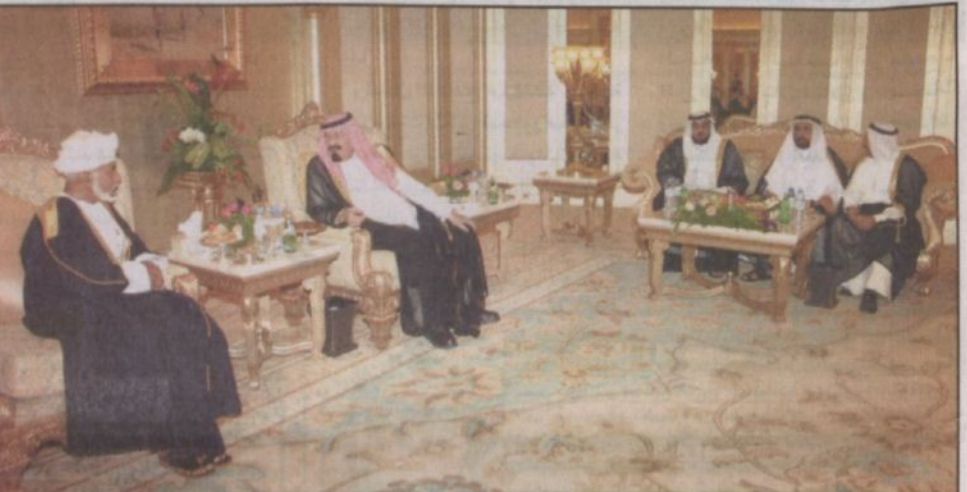
خادم الحرمين وقادة التعاون خلال حفل العشاء

أبو ظبي - علي القحبيص، أكد معالي الشيخ أحمد الصباح وزير الطاقة الكويتي أهمية الملف الاقتصادي المطروح على قمة قادة دول مجلس التعاون لدول الخليج العربية في ممتهم السادسة والعشرين بأبوظبي في تعزيز مسيرة المجلس. وقال معالي في تصريحات على هامش الجلسة المغلقة لقادة دول المجلس في قصر الإمارات بأبوظبي مساء أمس أن الملف السياسي يكتب أهمية أيضاً في تناوله للقضايا الإقليمية التي تتصل بالعراق ولبنان وسوريا وفلسطين وقضية جزر الإمارات الثلاث المحتلة من قبل إيران. وأوضح أن الملف الاقتصادي تأتي أهميته من أهمية السعي