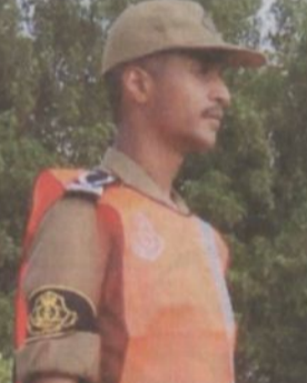
رئيس متدربي القوة الاحتياطية