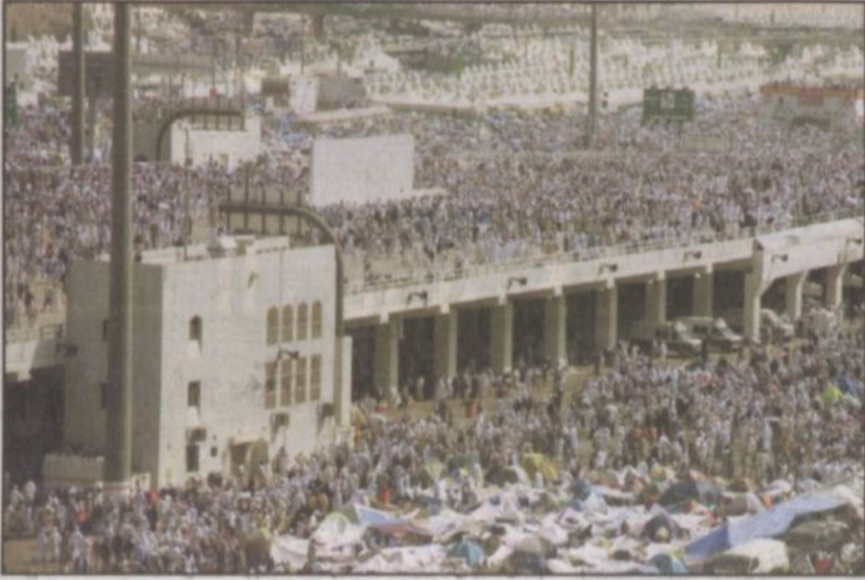
جموع الحجيج على جسر الجمرات

وقد نجحت عملية تفويج الحجاج اثناء رمي الجمرات يوم أمس أول أيام التشريق نجاحا كبيرا وكانت توعية الاحواض لها اثر ومساهمة في القضاء على التزاحم الذي كان يحدث للحجاج عند رمي الجمرات. وساهمت هذه الخطة الموضوعية بعناية في القضاء على جميع الحوادث التي تقع اثناء الرمي. وهذا يعكس التطور المستمر الذي تقوم به الجهات المعنية بالحج.