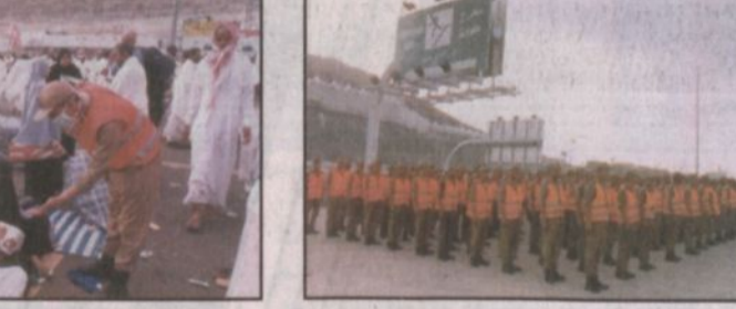
أفراد القوة يتهاون لخدمة الحجاج