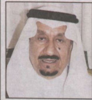
الأمير متعب بن عبدالعزيز

منى - و.أ.س. قام صاحب السمو الملكي الأمير متعب بن عبدالعزيز وزير الشؤون البلدية والقروية مساء أمس الأول بزيارة لمخيم الحرس الوطني في منى.