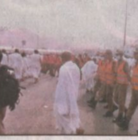
حاجز بشري من القوة لتنظيم حركة الحجاج

المشاعر المقدسة - بندر البكري. بهدف الشباب الحركة المرورية وتسهيل مرور السيارات على جسر الملك فيصل، كما تقوم القوة بدعم قوة منع الاقتراس. العميد عسييري... أشاد بالإعداد والتجهيز وبرامج التدريب لهذه القوة والتي تعتبر واجهة للمملكة أمام حجاج بيت الله والذين يتوافدون من جميع بقاع العالم، فهم يتعاملون مباشرة مع الحج في مواقع مختلفة وحساسة حيث أكد