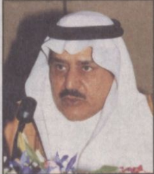
الأمير نايف بن عبدالعزيز

منى - واس. نقل صاحب السمو الملكي الأمير نايف بن عبدالعزيز وزير الداخلية رئيس لجنة الحج العليا شكر وتقدير منسوبي قوى الأمن الداخلي لخادم الحرمين الشريفين الملك عبدالله بن عبدالعزيز آل سعود - حفظه الله - على ما تفضل به - أيده الله - في كلمته الضافية خلال استقباله لهم بمناسبة حلول عيد الأضحى المبارك.