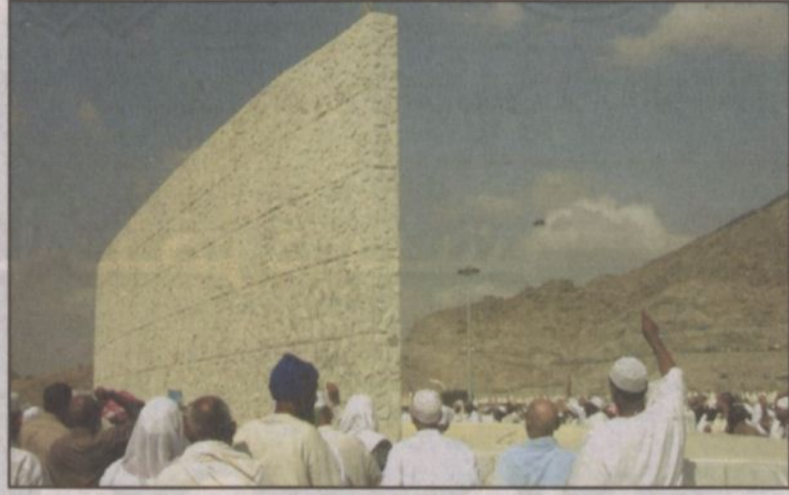
ضيوف الرحمن يرمون الجمرات الصغرى

منى - بعثة الرياض. مع زوال شمس يوم أمس تدفقت جموع حجاج بيت الله الحرام على منطقة الجمرات بمنى في ثاني أيام عيد الأضحى المبارك وأول أيام التشريق لرمي الجمرات الثلاث مبتدئين بالجمر الصغرى، ثم الوسطى، ثم جمر العقبة، تأسيا بالرسول الكريم محمد بن عبدالله صلى الله عليه وسلم وعلى أنه وصيه وسلم. وللمساعدة ضيوف الرحمن وتأمين المزيد من الأمن والأمان والسلامة لهم كتف رجال الأمن العام وقوى الأمن الداخلي والحرس الوطني والمرور والكشافة والدفاع المدني وغيرهم من الجهات المعنية لخدمة الحجاج جهودهم استعرازا واستشراقا للشرف العظيم الذي يضطلعون به لخدمة أخوان لهم جاءوا طلبا لمرضاة الله وأداء ركن من أركان الدين الاسلامي الحنيف.