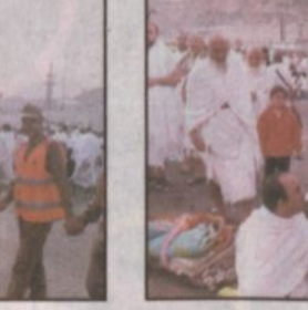
أحد أفراد القوة يقدم خدماته للحجاج