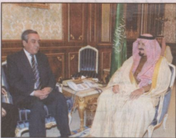
الأمير سلطان خلال استقباله السفير الأفغاني (واس)

الرياض - واس، استقبل صاحب السمو الملكي الأمير سلطان بن عبدالعزيز ولي العهد نائب رئيس مجلس الوزراء وزير الدفاع والطيران والمفتش العام في مكتب سموه بالديوان الملكي في قصر اليمامة بالرياض أمس سفير أفغانستان لدى المملكة محمد كبير فراهي الذي ودع سموه بمناسبة انتهاء فترة عمله سفيراً لبلاد لدى المملكة. ونقل السفير لسمو ولي العهد تحيات وتقدير فخامة الرئيس الأفغاني حامد كرزاي فيما حمله - حفظه الله - تحياته وتقديره لفخامته. كما عبر السفير لسمو ولي العهد عن شكره وتقديره لحكومة خادم الحرمين الشريفين الملك عبدالله بن عبدالعزيز - حفظه الله - بما حظي به من تعاون وتسهيلات خلال فترة عمله سفيراً لبلاد في المملكة. حضر الاستقبال معالي نائب رئيس ديوان سمو ولي العهد الأستاذ حمد عبدالعزيز السويلم.