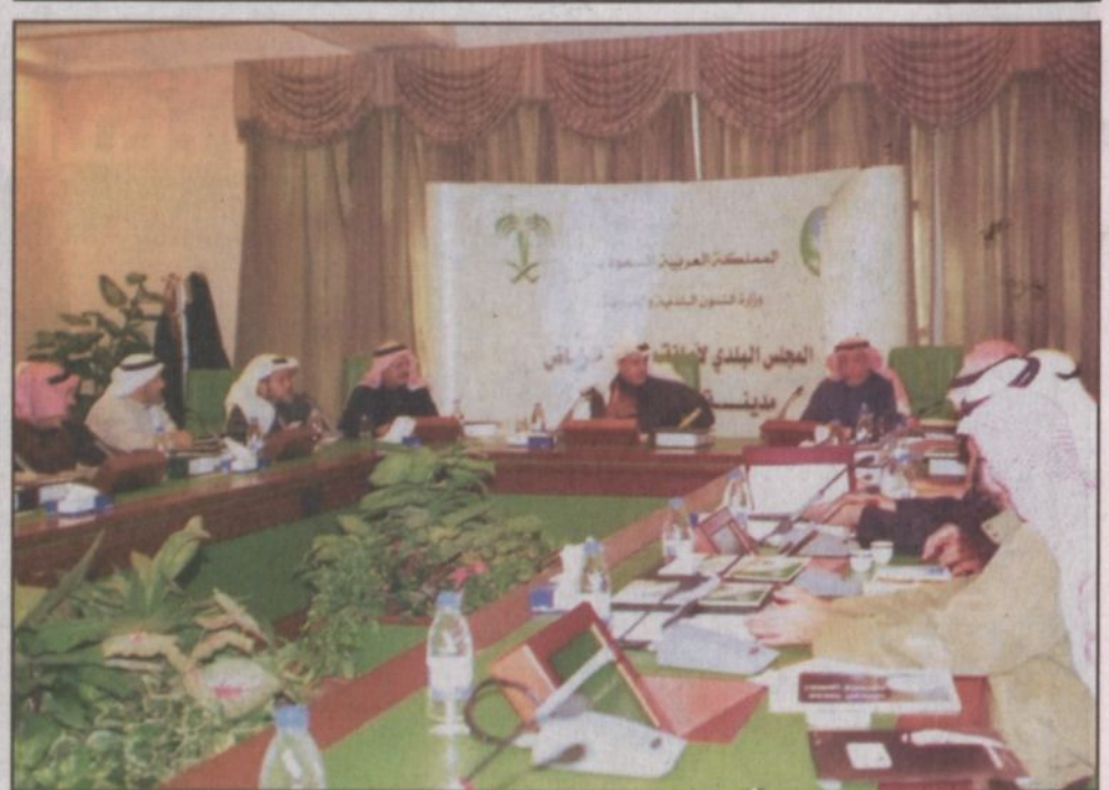
الأمير عبد العزيز بن عياف مترشحاً لإجماع المجلس البلدي لمدينة الرياض