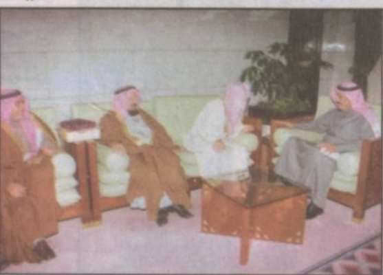
الأمير سلمان خلال الاستقبال (واس)

كما قدموا لسعود نسخة مخطوطة من تاريخ ابن بشر لحفظها في مركز المخطوطات بإدارة الملك عبدالعزيز. وعبر سمو الأمير سلمان بن عبدالعزيز عن شكره وتقديره لمبادرتهم ورغبتهم في إيداع هذه المخطوطة النادرة في الدارة تقديراً منهم لجهودها في خدمة التاريخ الوطني والمحافظة على مصادره. وقال سموه إن ماقدموه بعد إضافة مهمة ضمن مصادر المعلومات في دارة الملك عبدالعزيز وسوف نجد كل العناية والاهتمام، وأرباب أحفاد المؤرخ ابن بشر عن شكرهم واعتزازهم لاستقبال سموهم وعلى اهتمامهم بقدرين عالية سموه وتوجيهه بحفظ تاريخ وتراث والدهم في دارة الملك عبدالعزيز. حضر الاستقبال الأمين العام لدارة الملك عبدالعزيز الدكتور فهد بن عبدالله السماري.