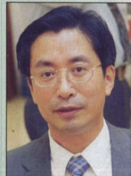
السفير الصيني لدى المملكة وتشو نهوا

وفد تجاري سعودي كبير يزور بكين بالتزامن مع زيارة خادم الحرمين التاريخية لتعزيز علاقات البلدين