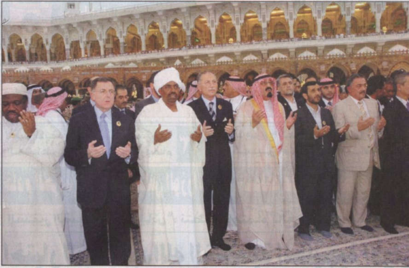
خادم الحرمين الملك عبدالله بن عبدالعزيز مع قادة العالم الإسلامي يدعون الله بنصرة الإسلام والمسلمين في ختام القمة الإسلامية الاستثنائية بمكة المكرمة