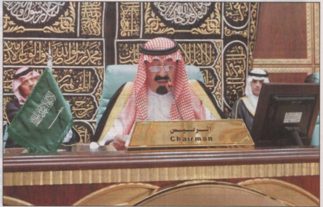
خادم الحرمين الشريفين الملك عبدالله بن عبدالعزيز خلال إلقاء كلمته في الجلسة الافتتاحية للقمة الإسلامية الاستثنائية