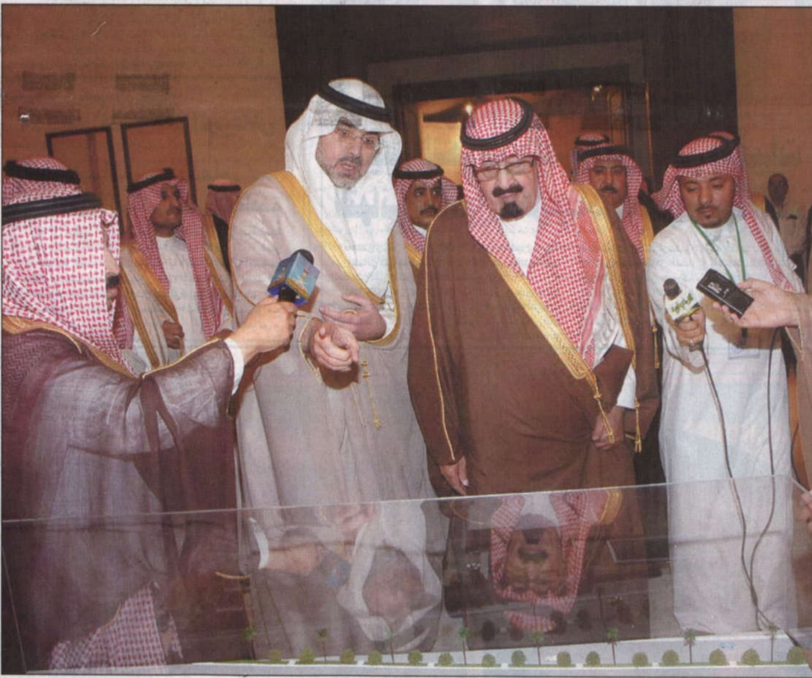
الملك عبدالله بن عبدالعزيز خلال استماعه إلى شرح محافظ هيئة الاستثمار عمرو الدباع لمجسم مدينة الملك عبدالله الاقتصادية

الملك عبدالله حريص على التكامل الخليجي وعلى المنجزات التي تم تحقيقها