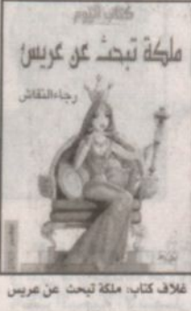
غلاف كتاب ملكة تبثت عن عريس

عزة بدر، يجيء كتاب ملكة تبثت عن عريس، ليزيح الستار عن المرأة عبر التاريخ، ولواجبه المتطلبات التي تعيشها، والتي تمكن في أن الثقافة أصبحت لا تؤخذ على حمل الجد، وأن عملية النقد قد شهدت شبه إسقاط متعمد للمتلقي أو القارئ نتيجة لعباب الحرية.