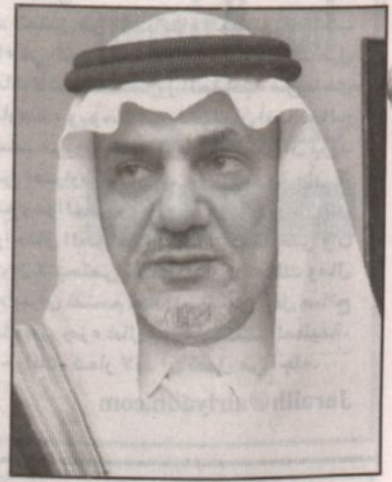
الأمير تركي الفيصل