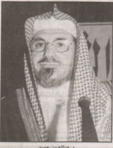
د. صالح بن حميد

ومنها مركز دراسة الإسلام والديمقراطية بواشنطن. وتكتسب هذه الندوة أهميتها من كونها ستناقش أسئلة جوهرية حول علاقة ديننا الإسلامي الحنيف بالمفاهيم الفكرية المطروحة في الساحات الإسلامية والدولية.