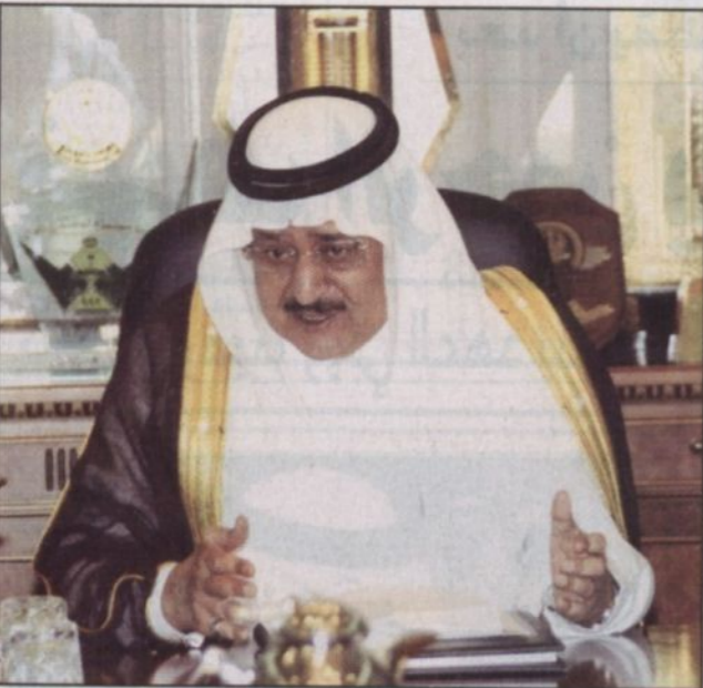
الأمير نايف يتحدث خلال الاجتماع

إبقاء لجنة التحقيق في حالة انعقاد دائم حتى انتهاء أعمالها