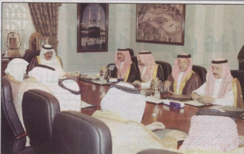
الأمير نايف يترأس الاجتماع الطارئ للجنة الحج العليا

يملك الفندق.. أو المسؤول عنه.. أو من الجهات الحكومية إذا كان ثبت لنا ان هناك جهة قصرت فيما يجب أن تقوم به. ووجه سموه كلمة للحجاج قائلاً، ارجو من الله أن يجعل جيتهم مبروراً وسعيهم مشكوراً.. وأن يتقبل حجهم.. كما أرجو أن يتعاونوا مع الجهات المسؤولة وفق التعليمات حتى يتمكنوا من أداء مناسكهم وحجهم في يسر وسهولة.. أما بالنسبة للجهات الحكومية فلا بد في تبذل كل جهة أقصى اهتمامها في حدود مسؤولياتها.