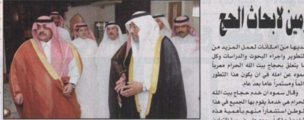
الأمير تركي بن سلطان خلال الزيارة

جدة - (و.أ.س): «بيان من الديوان الملكي، يعون الله تعالى ونياية عن خادم الحرمين الشريفين الملك عبدالله بن عبدالعزيز آل سعود ستوجه اليوم الخميس صاحب السمو الملكي الامير سلمان بن عبدالعزيز أمير منطقة الرياض على رأس وفد من رجالات الدولة الى دولة الامارات العربية المتحدة الشقيقة لتقديم العزاء في وفاة الشيخ مكتوم بن راشد آل مكتوم نائب رئيس دولة الامارات العربية المتحدة رئيس الوزراء حاكم دبي تغمده الله بواسع رحمته وأسكنه فسيح جناته.»