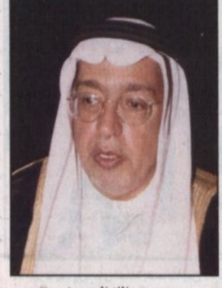
م. عبدالله الحسين

مكة المكرمة - خالد عبدالله. قام صاحب السمو الملكي الأمير تركي بن سلطان بن عبدالعزيز مساعد وزير الثقافة والإعلام امس بزيارة لمعهد خادم الحرمين الشريفين لبحاث الحج بجامعة ام القرى حيث كان في استقبال سموه عند وصوله الى المعهد وكيل جامعة ام القرى الدكتور هاشم بن بكر حريزي وعميد المعهد الدكتور اسامة بن فضل البار. وظهر وصول سموه قام بجولة على المعرض الدائم بالمعهد الذي يشتمل على العديد من المجموعات والصور الفوتوغرافية لبعض المشروعات التي نفذتها المملكة لخدمة حجاج بيت الله الحرام في مكة المكرمة والمشاعر المقدسة والمدينة المنورة إضافة الى الخدمات السياحية التي توضح الزيادة المطردة في اعداد الحجاج خلال اكثر من ٥٠ عاماً علاوة على بعض الصور التي توضح المشروعات التي قام المعهد