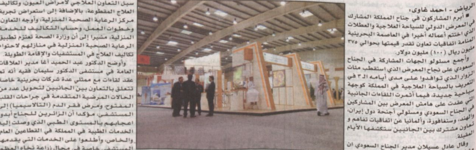
جانب من معرض البحرين بمشاركة الهيئة العليا للسياحة وجهات سعودية أخرى