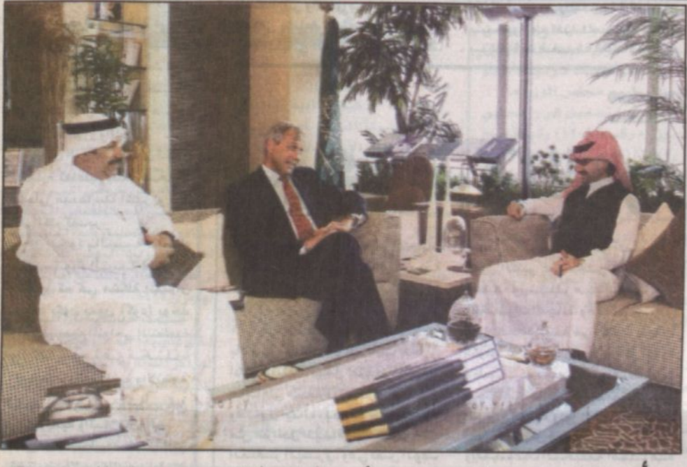
الأمير فهد بن سلطان يطلع على مجسم المشروع