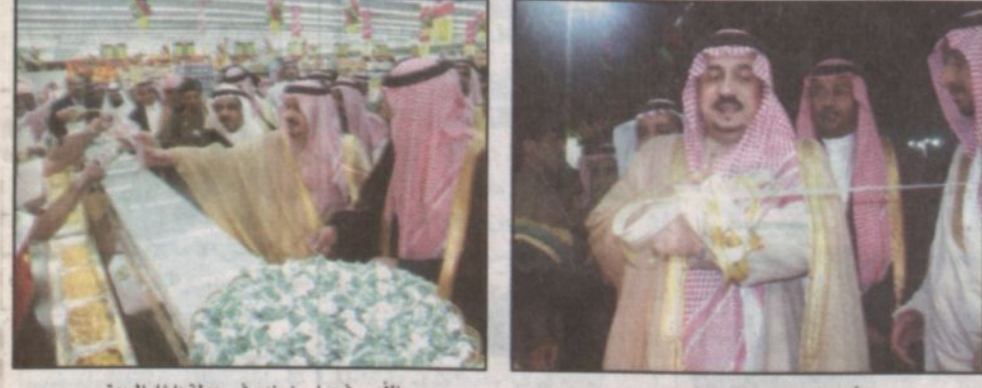
الأمير فيصل بن بندر في جولة داخل السوق