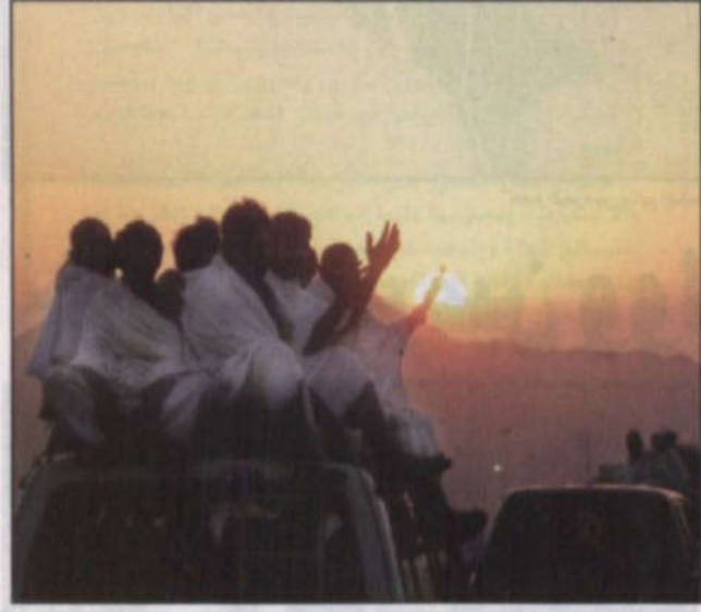
حجاج بيت الله الحرام يصعدون إلى عرفات بأسياب تامة. (روتيتز)

الشيخ عبدالعزيز آل الشيخ يدعو في خطبة نمرة إلى نهضة المسلمين والتسلح بمنظومة عسكرية اقتصادية وسياسية مضى - عرفات، بعثة «الرياض»، و.أ.س. وصل بحفظ الله ورعايته خادم الحرمين الشريفين الملك عبدالله بن عبدالعزيز آل سعود وصاحب السمو الملكي الأمير سلطان بن عبدالعزيز ولي العهد نائب رئيس مجلس الوزراء وزير الدفاع والطيران والمفتش العام أمس الاثنين إلى منى للإشراف على ما يقدم لحجاج بيت الله الحرام من خدمات وتسهيلات ليؤدوا مناسكهم في يسر وسهولة وأمان وكذلك متابعة مراحل الخطبة العامة لتنتقل الحجاج في المشاعر المقدسة. وشهد تصعيد عرفات يوم أمس الوقفة الكبرى، وعاشت جموع الحجيج في خشوع وتضرع إلى الله تعالى طالبين المغفرة والرحمة والعتق من النار. وتابع خادم الحرمين الشريفين الملك عبدالله بن عبدالعزيز وسمو ولي عهده الأمين - يحفظهما الله - عملية وصول الحجاج إلى عرفات. ثم نقرتهم إلى مزدلفة. واستقبل تصعيد عرفات أكثر من مليوني ونصف المليون حاج مع تباشر صباح أمس التاسع من شهر ذي الحجة من قوافل حجاج بيت الله الحرام الذين تدفقوا على هذا المشعر الحرام في مواكب إيمانية يغمرها الخشوع والسكينة مليئين متضرعين داعين الله عز وجل العفو والرحمة في هذا اليوم العظيم الذي لم تطلع الشمس على يوم خير منه. وقد أدت جموع حجاج بيت الله الحرام طهر أمس صلاتي الظهر والعصر جمعاً وقصراً في مسجد نمرة بعرفات اقتداءً بسنة النبي الكريم بعد أن انتظم عقدم على هذا التصعيد الطاهر. وأم المصلين سعادة الشيخ عبدالعزيز بن عبدالله آل الشيخ مفتي عام المملكة رئيس هيئة كبار العلماء وإدارة البحوث العلمية والإفتاء