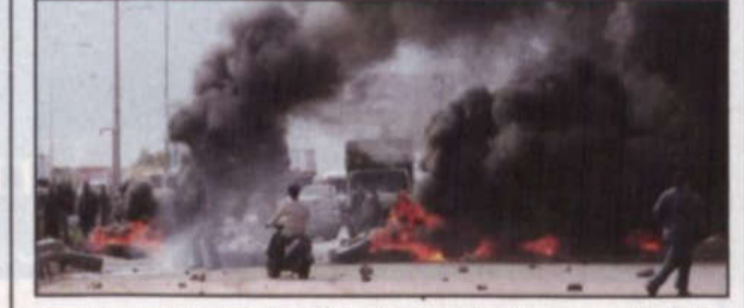
سكان من الناصرة يحرقون طائرات بعد التوتر الذي نشأ اثر إصابة شرطيين لبنانيين.

واشنطن، تل أبيب - وكالات الأنباء، نقل أمس ذلك تشيئي نائب الرئيس الأمريكي إلى مستشفى في واشنطن إثر إصابته بضيق في التنفس. وقالت (سي. إن. إن) أن نائب الرئيس نقل إلى مستشفى جورج واشنطن الجامعي نحو الساعة الثالثة صباحاً (الحادية عشرة قبل ظهر أمس بتوقيت الرياض). وصرح جيني مايفيلد المتحدث باسم مكتبه بأن تشيئي الذي عانى في السابق من مشاكل في القلب خرج من المستشفى الذي نقل إليه لعمالته من احتباس السوائل في جسمه بسبب دواء يتناوله لعلاج مشكلة في قدمه. وقد خرج تشيئي في وقت لاحق من المستشفى بعد أن مكث فيه أربع ساعات لاستكمال الفحوصات. وفي الكيان الإسرائيلي، أعلن البروفيسور شلومو مور يوسف مدير مستشفى هداسا أمس أن رئيس الوزراء الإسرائيلي أرييل شارون بات قادراً على التنفس بصورة تلقائية ولكنه لا يزال يتلقى مساعدة من الأجهزة الاصطناعية. وقال البروفيسور مور يوسف، بدأنا بتخفيف درجة التخدير.. في المرحلة الأولى، بدأ شارون يتنفس تلقائياً رغم أنه لا يزال موصولاً بجهاز التنفس الاصطناعي. وأضاف، هذه الإشارة الأولى على وجود نشاط دماغي..