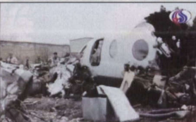
صورة لتفريغ حطام الطائرة «المالكون» الإيرانية

وكانت طائرة عسكرية إيرانية من طراز (سي-١٣٠) سقطت الشهر الماضي في طهران وقتل أكثر من مائة من ركابها معظمهم من الصحافيين الإيرانيين. على صعيد آخر، عبر ولفغانغ شوسل المستشار الألماني الذي تتولى بلاده رئاسة الاتحاد الأوروبي عن قلقه الشديد، أمس إزاء احتمال استئناف إيران أنشطتها النووية الحساسة وحث من أن فرض عقوبات على طهران لا يزال خياراً