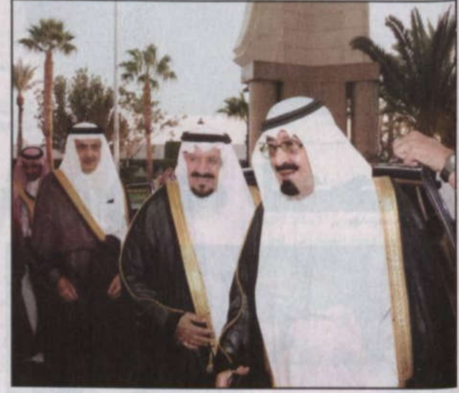
وصول خادم الحرمين وولي عهد الأمين إلى المشاعر المقدسة

الشيخ عبدالعزيز آل الشيخ يدعو في خطبة نمرة إلى نهضة المسلمين والتسلح بمنظومة عسكرية اقتصادية وسياسية مضى - عرفات، بعثة «الرياض»، و.أ.س. وصل بحفظ الله ورعايته خادم الحرمين الشريفين الملك عبدالله بن عبدالعزيز آل سعود وصاحب السمو الملكي الأمير سلطان بن عبدالعزيز ولي العهد نائب رئيس مجلس الوزراء وزير الدفاع والطيران والمفتش العام أمس الاثنين إلى منى للإشراف على ما يقدم لحجاج بيت الله الحرام من خدمات وتسهيلات ليؤدوا مناسكهم في يسر وسهولة وأمان وكذلك متابعة مراحل الخطبة العامة لتنتقل الحجاج في المشاعر المقدسة. وشهد تصعيد عرفات يوم أمس الوقفة الكبرى، وعاشت جموع الحجيج في خشوع وتضرع إلى الله تعالى طالبين المغفرة والرحمة والعتق من النار. وتابع خادم الحرمين الشريفين الملك عبدالله بن عبدالعزيز وسمو ولي عهده الأمين - يحفظهما الله - عملية وصول الحجاج إلى عرفات. ثم نقرتهم إلى مزدلفة. واستقبل تصعيد عرفات أكثر من مليوني ونصف المليون حاج مع تباشر صباح أمس التاسع من شهر ذي الحجة من قوافل حجاج بيت الله الحرام الذين تدفقوا على هذا المشعر الحرام في مواكب إيمانية يغمرها الخشوع والسكينة مليئين متضرعين داعين الله عز وجل العفو والرحمة في هذا اليوم العظيم الذي لم تطلع الشمس على يوم خير منه. وقد أدت جموع حجاج بيت الله الحرام طهر أمس صلاتي الظهر والعصر جمعاً وقصراً في مسجد نمرة بعرفات اقتداءً بسنة النبي الكريم بعد أن انتظم عقدم على هذا التصعيد الطاهر. وأم المصلين سعادة الشيخ عبدالعزيز بن عبدالله آل الشيخ مفتي عام المملكة رئيس هيئة كبار العلماء وإدارة البحوث العلمية والإفتاء