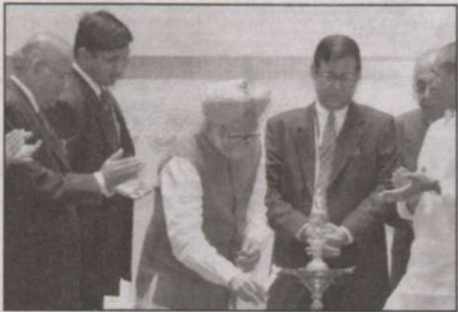
الهند تمنح الجنسية المزدوجة لأبنائها في المهجر

نيودلهي - مكتب «الرياض»، د. ظفر الإسلام خان، بعد تلكؤ شديد ودراسات أجريت لعشر سنوات، وافقت الحكومة الهندية أخيراً على منح الجنسية المزدوجة للهنود القاطنين في الخارج ممن جنسوا جنسيات أجنبية.