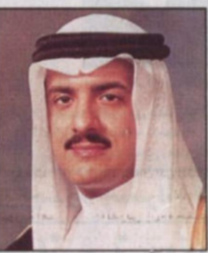
الأمير سلطان بن سلمان

كتيب - مندوب «الرياض»، ■ تبرع صاحب السمو الملكي الأمير سلطان بن سلمان، رئيس مؤسسة التراث بمبلغ ١٠٠ ألف ريال لترميم ٤ منابر في منطقة شبام الأثرية من ضمنها منبر جامع شبام الكبير في محافظة حضرموت وذلك أثناء زيارته المواقع الأثرية والتاريخية في اليمن. ويأتي تبرع سموه انطلاقاً من اهتمامه بالتراث الإسلامي والأهمية تلك المنابر التاريخية وحاجتها الماسة الى الترميم العاجل. وسيتم الترميم وفق الأسس الهندسية العالمية بدءاً بالتوثيق الشامل، كما سيتم تأهيل كوادر متخصصة للقيام بهذه