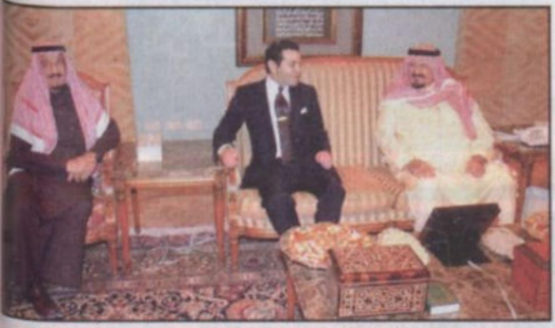
سمو ولي العهد يستقبل الأمير رشيد بحضور الأمير سلمان

الرياض - (واس) ■ استقبل صاحب السمو الملكي الأمير سلطان بن عبدالعزيز ولي العهد نائب رئيس مجلس الوزراء وزير الدفاع والطيران والمفتش العام برقية تهنئة لجلالة الامبراطور أكيهيتو امبراطور اليابان بمناسبة ذكرى اليوم الوطني لبلاد. وأعرب سمو ولي العهد عن أبلغ التهاني وأطيب الاماني بموفور الصحة والسعادة لجلالته وللشعب الياباني اضفراء التقدم والرقي.