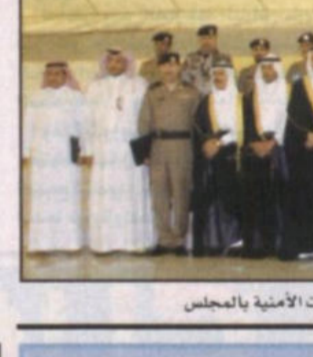
كتيب - بندر الناصر

بمجلس المدينة الرياض اول اجتماعاته يوم الاثنين المقبل لاختيار رئيسه ونائبه الذي سيتم عبر تصويت الاعضاء. اوضح ذلك امين منطقة الرياض الأمير الدكتور عبدالعزيز بن محمد آل مقرن الذي قال ان النظام قد كفل للمواطن التواصل مع اعضاء المجلس وذلك من خلال لقاءات تكون دورية ومفتوحة مضيفاً أن عمل المجلس هو تلقي شكاوى المواطنين واقتراحاتهم.