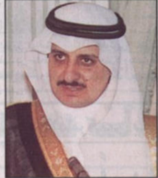
الأمير فهد بن سلطان

كتاب - مندوب «الرياض»، ■ نيابة عن خادم الحرمين الشريفين الملك عبدالله بن عبدالعزيز يقوم صاحب السمو الملكي الأمير فهد بن سلطان بن عبدالعزيز أمير منطقة تبوك برعاية حفل افتتاح مشروع قرية (الشعبان) ومشروع قرية (الحسي) اللذين يقعان على الساحل الغربي، في منطقة تبوك. وذلك يوم غد السبت في مقر المشروع بقرية (الشعبان) وسوف تسلم في هذا الحفل وثائق تخصيص للمواطنين المرشحين، وكذلك مفاتيح المنازل والبالغ عددها (٨٤) منزلاً وبلغت تكلفة المشروع ومرافقها وتجهيزاتها (٣١,٥٠٠,٠٠٠) ريالاً وثلثاين مليوناً وخمسة آلاف ريال. صرح بذلك الأمين العام لمؤسسة الدكتور يوسف بن أحمد العثيمين.