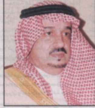
الأمير فيصل بن بندر

بمبلغ أكثر من ٢٢٩,٥ مليون ريال. ومن جهة أخرى يبدشن سموه ظهر غد السبت مبنى الكلية المتوسطة للبنات بمدينة بريدة كما يبدشن مغرب غد مبنئ كلية العلوم الصحية للبنين بمحافظة الجبكية