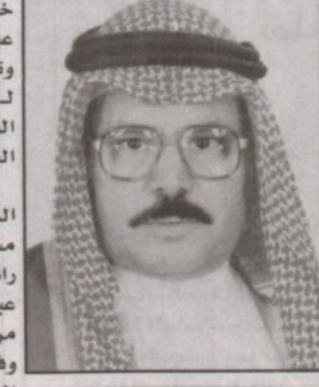
بقله: د. عبدالله بن عبدالعزيز آل سعود