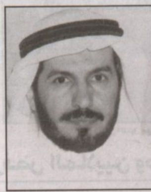
بقله: د. عبدالله بن عبدالعزيز آل سعود

ليست أعدادهم بالشكل الملائم وتخريجهم بعد عدد من السنوات أطباء وما تسطره لنا حكايات التواضع السيامية واليد التي أخذت بهذه المعاناة إلى طريق الشفاء وكان المركب الذي عبر من خلاله هؤلاء هو إنسانية خادم الحرمين الشريفين التي جعلت من المعاناة طريقاً للفرح والسعادة وهذا ما لا دليل على اهتمام القائد وتلمسه لحاجات الناس للرعاية الصحية التي تخفف من معاناتهم وتمسح عنهم همومهم بصرف النظر عن اللون والعرق والعقيدة لكون اللسان الإنسانية تمنى بالإنسان بصرف النظر عن أي شيء آخر. ولم يوجه - حفظه الله - بذلك إلا لثقته بالله أولاً ومن ثم بأبنائه الأطباء السعوديين والذين كانوا من غرسه - حفظه الله - حتى أصبح أطباءنا مؤهلين ومسلحين بأخر ما تم التوصل إليه في المجال الطبي. وقد خطت المملكة خطوات واسعة وكبيرة في مجال فصل التوائم مسطرة أنواع التلاحم بين أنسجة الإنسان على اختلاف الأديان والأجناس والأشكال