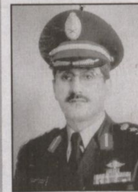
عقيد ركن دكاه بن عبدالعزيز دعبش

تحت قيادة عبدالله بن عبدالعزيز شهد الحرس الوطني نهضة شاملة يلهمها من عرف الحرس الوطني قبل ما يقارب الثلاثين عاماً عندما كان قوات شبه عسكرية وتقيم في معسكرات من الخيام ويتولى الرعاية الصحية فيها طبيب من القليل من الرعاية الصحية وبعض مراكز التدريب وجنود غالبيتهم اميون لا يقرأون ولا يكتبون بسكن وبعضهم في مبان مسقوفة بالصفيح.. كان هذا واقع حال الحرس الوطني في بداية الثمانينيات الهجرية بعد تولي خادم الحرمين الشريفين - حفظه الله - رئاسة الحرس الوطني الخشط استراتيجية شاملة لتغيير هذا الوضع وكما نرى جميعاً ما هو الحرس الوطني السعودي القوة العسكرية الباسلة والمتحررة والتي أصبحت أحد أهم عوامل الاستقرار الأمني وأحد شواهد التطور في جميع المجالات حيث كانت رؤية القائد عندما اراد أن يكون الحرس الوطني ليس مؤسسة عسكرية فقط بل حضارية أيضاً. هاهي المدارس والمعاهد والأكاديميات العسكرية والطبية ما هي المدن السكنية العملاقة ما هي الخدمات الطبية ذات المعايير العالمية ما هو الحرس الوطني المؤسسة الحضارية التي أصبحت جزءاً من المجتمع وأهم مكوناته حيث يذكر الحرس الوطني عن ذكر أي مجهوب خير رينا في هذا الوطن ما هو الحرس الوطني التاريخ والحضارة والتراث كل ذلك تحقق بفضل قائد عظيم أحب الحرس الوطني وأخلص للكان له مكان في قلب كل جندي في الحرس الوطني الذي خادم الحرمين الشريفين الملك عبدالله بن عبدالعزيز - حفظه الله - الذي تعلمنا منه دروساً عظيمة في الوفاء والولاء لهذا الوطن وهذه المؤسسة العظيمة الحرس الوطني.