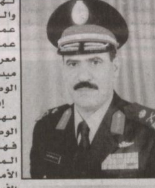
بقله: اللواء ركن عبدالعزيز بن محمد العياض

لقد خطا الحرس الوطني خطوات جبارة في تأهيله وتنظيمه وتدريبه العسكري تحت قيادة خادم الحرمين الشريفين حفظه الله وأيده بنصره، منذ تسلمه رئاسته عام ١٣٨٢هـ. فالحرس الوطني كان عبارة عن كتائب مشاة محدودة التنظيم والتدريب والتسلح تحولت وفق خطته وتوجيهاته حفظه الله إلى وحدات متطورة آلية في معظمها، حديثة في تسليحها وفي تنظيمها، متكاملة الجوانب في إنسانها الناري والإداري، إضافة إلى المؤسسات التي تساعده في المحافظة على كفاءتها من مدارس وكتليات ومعاهد، وهياً البيئة التي تضاعف قدراتها وتضخدهم أفرادها من مدن عسكرية متكاملة ومعسكرات حديثة، فأصبح الحرس الوطني فخراً لكل من ينسب إليه، وأماً لكل شاب طموح ينشد شرف الخدمة وفق حياة كريمة ومستقبل واعد. ومن خلال خطة تطوير وحدات الحرس الوطني المدروسة تم بناء قوة آلية تتمتع بقوة نار وخفة حركة واكتفاء ذاتي تمكنها من تأدية المهام المناطة بها بكل اقتدار، ولعل الجاهزية التي تديها وحداته بصفة مستمرة عند تلبية النداء