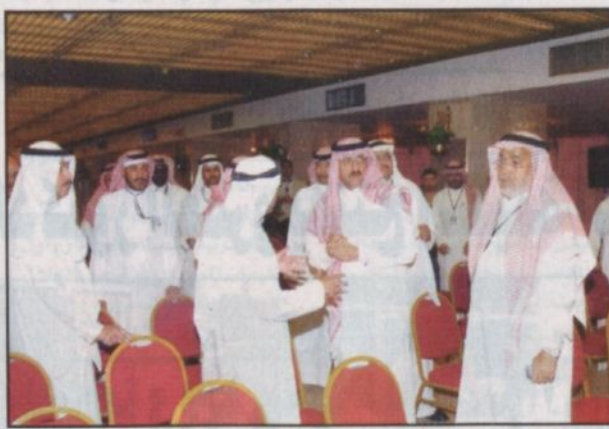
جولة سمو الأمير محمد بن نايف في المركز الإعلامي (و.أ.س)

مكة المكرمة - (و.أ.س)، قام صاحب السمو الملكي الأمير محمد بن نايف بن عبدالعزيز مساعد وزير الداخلية للشؤون الأمنية مساء أمس بزيارة للمركز الإعلامي للقمة الإسلامية الاستثنائية الثالثة بفندق الشهداء في مكة المكرمة التي ستعقد بمشيئة الله يومي الاربعاء والخميس المقبلين اطلع خلالها على اقسام المركز وما وفرته وزارة الثقافة والاعلام من تجهيزات لتسهيل عمل الصحفيين والاعلاميين المشاركين في تغطية فعاليات القمة.