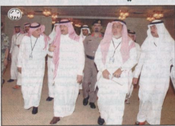
الأمير محمد بن نايف خلال جولته في المركز الإعلامي (و.أ.س)

مكة المكرمة - (و.أ.س)، قام صاحب السمو الملكي الأمير محمد بن نايف بن عبدالعزيز مساعد وزير الداخلية للشؤون الأمنية مساء أمس بزيارة للمركز الإعلامي للقمة الإسلامية الاستثنائية الثالثة بفندق الشهداء في مكة المكرمة التي ستعقد بمشيئة الله يومي الاربعاء والخميس المقبلين اطلع خلالها على اقسام المركز وما وفرته وزارة الثقافة والاعلام من تجهيزات لتسهيل عمل الصحفيين والاعلاميين المشاركين في تغطية فعاليات القمة.