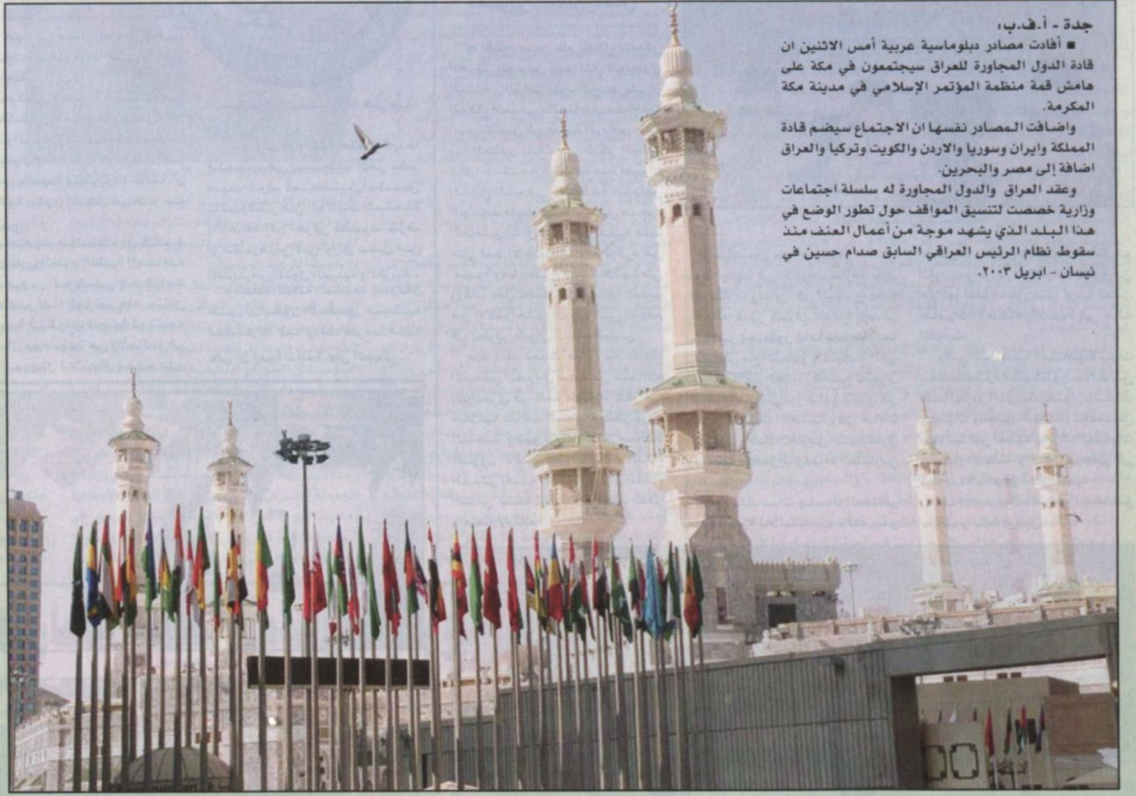
أعلام الدول الإسلامية المشاركة في قمة مكة وتبدو خلفها مآذن الحرم المكي.

جدة - أ.ف.ب.، أفادت مصادر دبلوماسية عربية أمس الاثنين ان قادة الدول المجاورة للعراق سيجتمعون في مكة على هامش قمة منظمة المؤتمر الإسلامي في مدينة مكة المكرمة. وأضافت المصادر نفسها ان الاجتماع سيضم قادة المملكة وإيران وسوريا والأردن والكويت وتركيا والعراق إضافة إلى مصر والبحرين. وعقد العراق والدول المجاورة له سلسلة اجتماعات وزارية خصصت لتنسيق المواقف حول تطور الوضع في هذا البلد الذي يشهد موجة من أعمال العنف منذ سقوط نظام الرئيس العراقي السابق صدام حسين في نيسان - ابريل ٢٠٠٣.