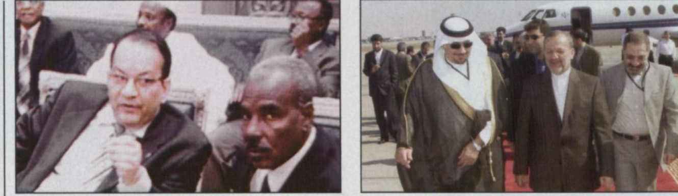
وصول عدد من وزراء خارجية الدول الإسلامية امس