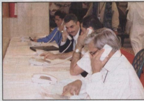
عدد من الاعلاميين في المركز الإعلامي