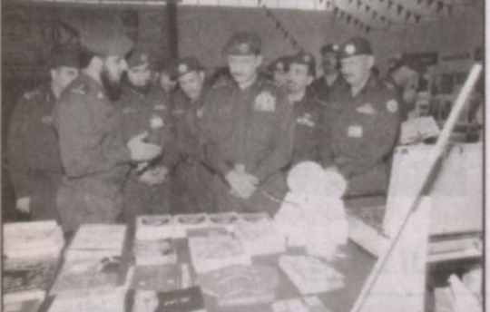
الفريق عبدالرحمن الفيصل في جولة داخل المعرض

الرياض - كتب - محمد الحيدر، افتتح سمو الفريق الركن عبدالرحمن بن فهد الفيصل قائد القوات الجوية الملكية السعودية أمس معرض القوات الجوية السنوي للسلامة وذلك في مركز سلطان الرياض بمقر كلية الملك فيصل الجوية بالرياض. وفور وصوله قام سموه بقص الشريط حيث تجول في المعرض الذي شاركت فيه عدد من القطاعات الحكومية والخاصة ذات الاهتمام بأمن السلامة، حيث أبدى سموه إعجاباً بما شاهدته من تطور لكافة أنواع السلامة وما توصل إليه العلم في هذا المضمار. من جهته أوضح اللواء طيار عبدالله السعدون قائد كلية الملك فيصل الجوية أنه بصاحب المعرض عدد من المحاضرات عن السلام يشارك فيها نخبة من المختصين والمهتمين من الجوية وموجعة لزوار المعرض، ويستمر حتى يوم الأربعاء المقبل، مؤكداً أن الكلية تحرص على التعريف بأهمية السلامة في المجال الجوي والأرضي.