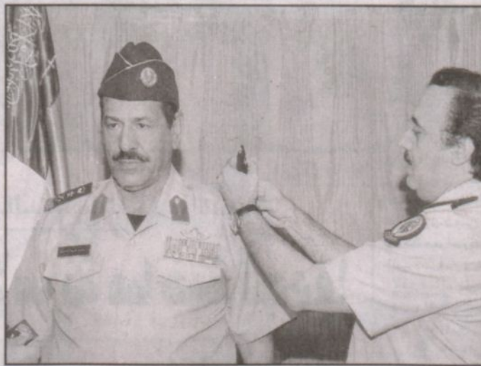
الفريق أول ركن متعب بن عبد الله يقبل العنزي رتبته الجديدة

الرياض - مندوب - قائد صاحب السمو الملكي الفريق أول ركن متعب بن عبد العزيز نائب رئيس الحرس الوطني المساعد للشؤون العسكرية الأسبق العاصمي في مكتبة برئاسة الحرس الوطني بالرياض الفريق الركن متعب بن جوال بن وائل العنزي رئيس الهيئة العامة للشؤون العسكرية وترتبته الجديدة بعد صدور الأمر الملكي الكريم بتربيته إلى رتبة فريق ركن. وقد هنأ سموه على هذه الثقة الملكية متمنياً أن تكون عوناً له في خدمة الدين ثم الملك والوطن ودافعاً إلى بذل المزيد لخدمة هذه البلاد الطاهرة في ظل قيادتنا الرشيدة حفظها الله. من جانبه عبر الفريق الركن متعب العنزي عن شكره وامتنانه للقيادة الكريمة على الثقة الملكية العالية والتي تدفع للتفاني في خدمة الدين ثم الملك والوطن راجياً من المولى عز وجل أن يديم على بلادنا نعمة الأمن والاستقرار. وحضر التقليد اللواء ركن بندر بن ماجد الخثيلة رئيس هيئة الإمداد والتأمين واللواء مساعد بن عبدالعزيز الشلهوب رئيس هيئة شؤون الأفراد واللواء سلطان بن محمد الشنقيطي مدير إدارة شؤون الضباط والعميد فيصل بن سعيد الشاطر رئيس هيئة الاستخبارات بالنيابة.