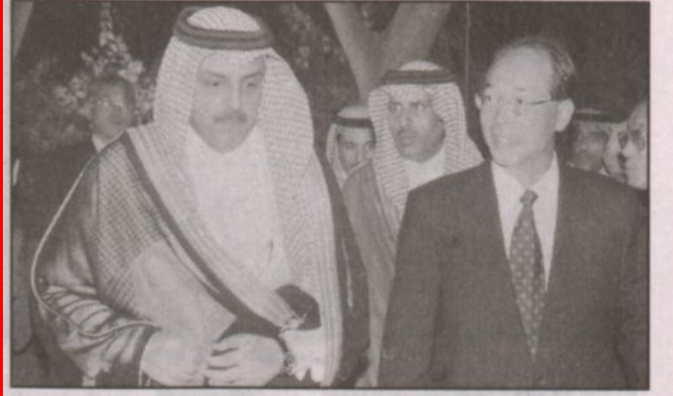
الأمير عبدالعزيز خلال الحفل (و.ا.س.)

الرياض - (و.ا.س.) - نيابة عن صاحب السمو الملكي الأمير سلمان بن عبدالعزيز آل سعود أمير منطقة الرياض حضر صاحب السمو الأمير الدكتور عبدالعزيز بن محمد بن عياف آل مقرن أمين منطقة الرياض حفل الاستقبال الذي أقامته سفارة اليابان لدى المملكة بمناسبة ذكرى الخمسين للعلاقات الدبلوماسية بين المملكة العربية السعودية واليابان والذي تنظمه هيئة التجارة الخارجية اليابانية ( جيترو)، وذلك بمنزل السفير بحي السفارات بالرياض. وكان في استقبال سموه لدى وصوله مقر الحفل سفير اليابان لدى المملكة ياسو سايتو وعدد من أعضاء السفارة. وحضر الحفل عدد من رجال الأعمال السعوديين واليابانيين.