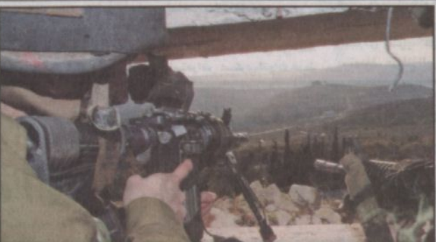
جنود اسرائيليون في موقع لهم على طول الحدود الإسرائيلية - اللبنانية

والأوساط الدبلوماسية المعنية بأنه سوف يحدد مهلة زمنية لأجل إعادة جثث الشهداء وهو سيكون في حل من الاتفاق على وقف إطلاق النار، الذي توصلت إليه قوات الطوارئ الدولية ليل الاثنين. ولاحظ مصدر مسؤول في الحزب أن ما جرى في محيط ميس الجبل، حيث سقط المظلي الإسرائيلي أمس الأول، معزول عما جرى في مزارع شبعا ومحيطها، مستغرباً أن (إسرائيل) قالت إن المظلي الذي وقع في حقل أنعام على الحدود كان يقود طائرة شراعية، في ظل الوضع المتوتر وفي الوقت الذي التزم فيه المستوطنون منازلهم ونموا من التحول. وأكد المصدر أن الأمور في الوقت الراهن تتجه نحو التهدئة، كاشفاً عن الاتصالات بين الإسرائيليين وقوات الطوارئ من جهة وبين الطوارئ والحكومة اللبنانية وقيادة الحزب من جهة ثانية، إضافة إلى وجود اتصالات من قبل عدد من السفراء مع الحكومة اللبنانية بغية العمل على الحؤول دون تفاقم الوضع وتعميقه. وقال إن قيادة الحزب ابسغت من الاعتداءات (إسرائيل) يجب أن تلتزم بوقت قريب، بتسليم جثث الشهداء، ولا سيكون للمقاومة كلام آخر، مبدياً اعتقاده بأن (إسرائيل) ستلتزم بعدها لأنها تلتفت الرساء بصورة جيدة. تجدر الإشارة إلى أن رئيس الحكومة اللبنانية فؤاد السنيورة ادان قبل مغادرته دولة قطر أمس الأول الانتهاكات الإسرائيلية، معتبراً أن المطلوب تسليم جثث المقاومين الذين سقطوا، مؤكداً أن هذا الأمر ضروري من أجل نزع فتيل التوتر على الحدود الدولية للبنان.