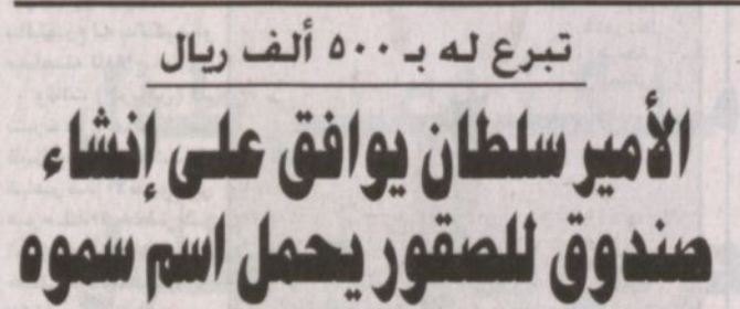
الأمير سلطان عاشق للصقور وداع لحمايتها