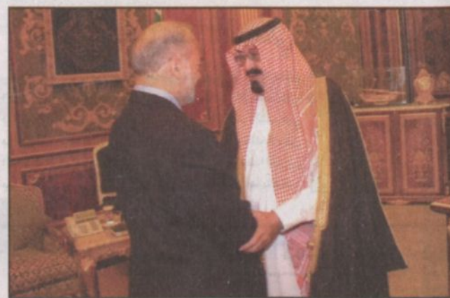
خادم الحرمين مستقبلاً رئيس الوزراء العراقي