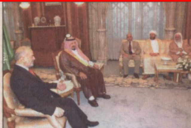
الأمير سلطان مستقبلاً رئيس الوزراء العراقي

الرياض - واس، استقبل خادم الحرمين الشريفين الملك عبدالله بن عبدالعزيز آل سعود - حفظه الله - بمكتبه في الديوان الملكي بقصر اليمامة امس دولة رئيس وزراء جمهورية العراق الدكتور ابراهيم الجعفري والوفد المرافق له. وقد رحب الملك المعفدى خلال الاستقبال بدولة رئيس الوزراء العراقي متمنيا له والوفد المرافق طيب الإقامة في المملكة العربية السعودية. من جهته أرب دولة رئيس الوزراء العراقي عن شكره وتقديره لخادم