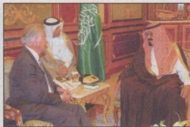
خادم الحرمين الشريفين يستقبل وفد من مجلس العموم البريطاني.