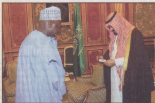
الملك عبدالله يستقبل مدير منظمة الأغذية والزراعة للأمم المتحدة