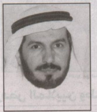
بقله: د. عبدالله بن عبدالعزيز آل سعود

ليست أعدادهم بالشكل الملائم وتخريجهم بعد عدد من السنوات أطباء متميزين ليخدموا هذا البلد وبنائه. وما تسطره لنا حكايات التوالم السيامية واليد التي أخذت بهذه المعاناة إلى طريق الشفاء وكان المركب الذي عبر من خلاله هؤلاء هو إنسانية خادم الحرمين الشريفين التي جعلت من المعاناة طريقاً للفرح والسعادة وهذا ما لا دليل على اهتمام القائد وتلمسه لحاجات الناس للرعاية الصحية التي تخفف من معاناتهم وتمسح عنهم همومهم بصرف النظر عن اللون والعرق والعقيدة لكون اللسان الإنسانية تمنى بالإنسان بصرف النظر عن أي شيء آخر. ولم يوجه - حفظه الله - بذلك إلا لثقته بالله أولاً ومن ثم بأبنائه الأطباء السعوديين والذين كانوا من غرسه - حفظه الله - حتى أصبح أطباءنا مؤهلين ومسلحين بأخر ما تم التوصل إليه في المجال الطبي. وقد خطت المملكة خطوات واسعة وكبيرة في مجال فصل التوائم مسطرة أنواع التوالم بين إنسانية الإنسان على اختلاف الأديان والأجناس والأشكال