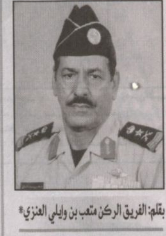
بقله: الفريق الركن متعب بن ويلي العزي

وقد شد عضده في جميع المجالات سمو الأمير بدر بن عبدالعزيز وسمو نائبه المساعد للشؤون العسكرية سمو الأمير الفريق أول الركن متعب بن عبدالله بن عبدالعزيز الذي كانت توجيهاته وإشرافه المباشر على جميع البرامج الخاصة بتطوير الحرس الوطني وتنفيذها كان لها الأثر الكبير على القادة لكي يتفانوا في أداء واجبه وهذا ليس بكتير على الجميع لأن حافزهم الرئيس خدمة ملكهم ومجتمعهم. وفق له خادم الحرمين وشده بولي عضده