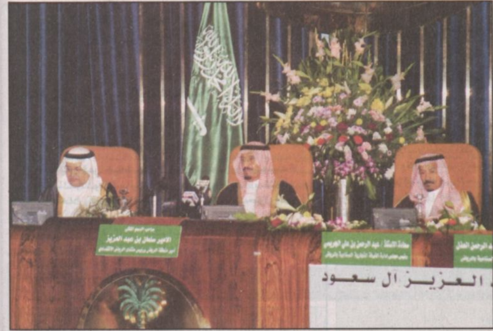
امير منطقة الرياض راعياً للحفل