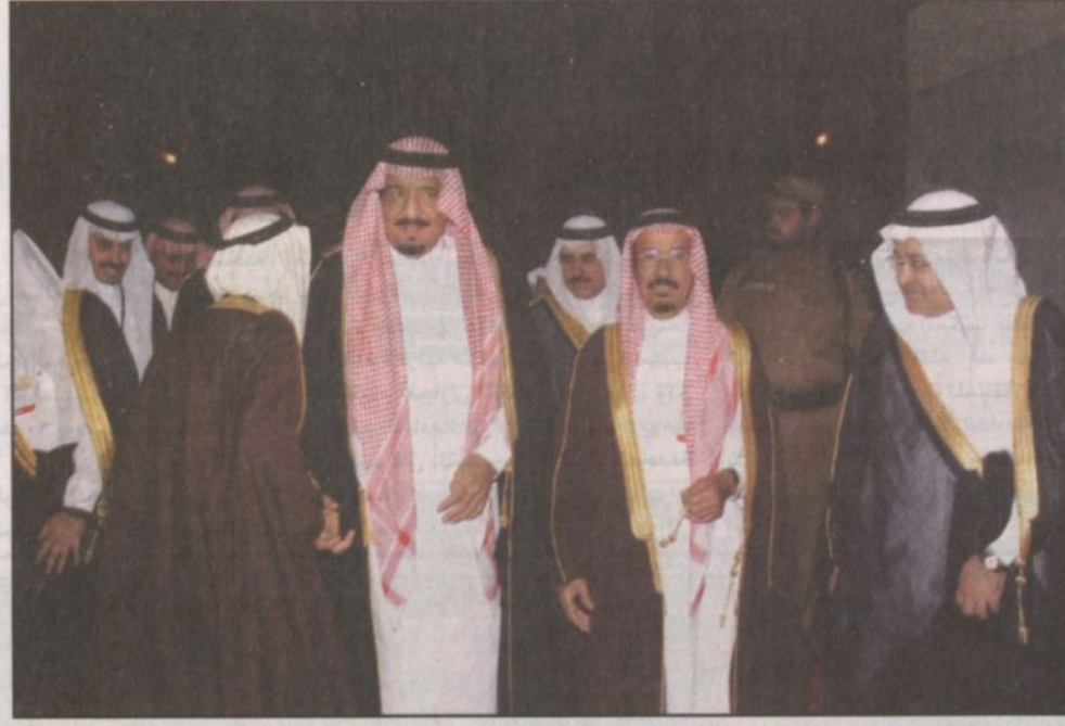
الأمير سلمان لدى وصوله مقر الحفل