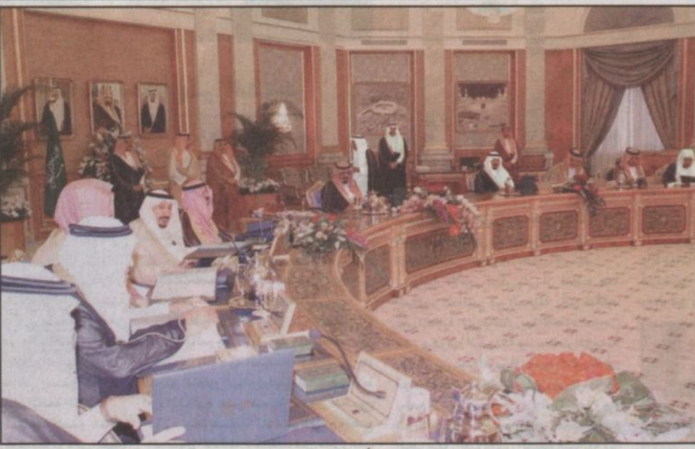
خادم الحرمين مترسلاً جلسة مجلس الوزراء

وقال الملك المفدى ان أملاً كبيراً يحودنا جميعاً أن تصل القمة التي تعقد في أقدس بقاع الأرض مكة المكرمة الى ما يعزز وحدة الصف ورمع الشمل وأن تعيد بتوفيق الله الثقة بالنفس لامة الإسلاميه لتمارس دورها التنويري والمؤثر في عالم اليوم وأن تؤكد بصورة عملية التزام الدول الاعضاء بمنظمة المؤتمر الإسلامي بالعمل الإسلامي المشترك وخاصة في محاربة آفات المرض والفقر وتكثيف شعوبها من المنافسة في عالم اليوم.