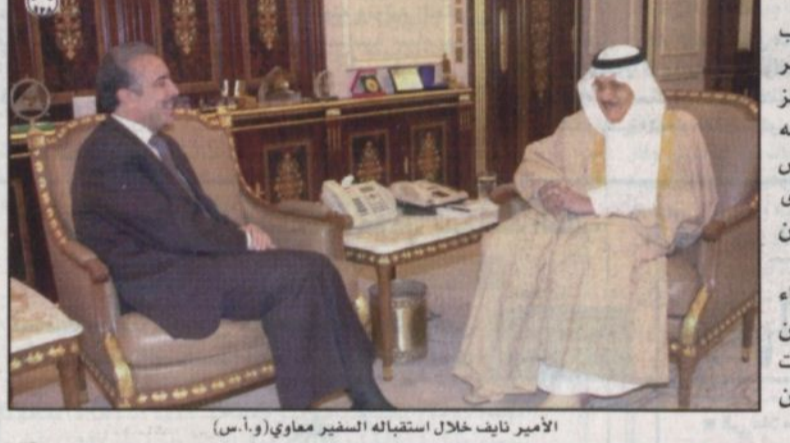
الأمير نايف خلال استقباله السفير معاوي

الرياض - و.أ.س، ■ استقبل صاحب السمو الملكي الأمير نايف بن عبدالعزيز وزير الداخلية بمكتبه بالوزارة بالرياض أمس السفير التونسي لدى المملكة صلاح الدين معاوي. وتم خلال اللقاء بحث عدد من الموضوعات ذات الاهتمام المشترك بين البلدين الشقيقين.