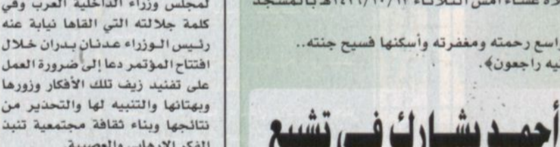
الأمير أحمد يشارك في تشييع جنازة الأميرة الجوهرة بنت خالد

الرياض - و.أ.س، ■ شارك صاحب السمو الملكي الأمير أحمد بن عبدالعزيز نائب وزير الداخلية وصاحب السمو الملكي الأمير تركي الفيصل سفير خادم الحرمين الشريفين لدى واشنطن وصاحب السمو الملكي الأمير مشعل بن ماجد بن عبدالعزيز محافظ جدة وعدد من أصحاب السمو الأمراء في تشييع جثمان سمو الأميرة الجوهرة بنت خالد بن محمد حرم صاحب السمو الملكي الأمير عبدالله الفيصل في مقابر العدل بمكة المكرمة بعد صلاة العشاء أمس. جدة - خالد الدماك، ■ شارك صاحب السمو الملكي الأمير أحمد بن عبدالعزيز نائب وزير الداخلية وصاحب السمو الملكي الأمير تركي الفيصل سفير خادم الحرمين الشريفين لدى واشنطن وصاحب السمو الملكي الأمير مشعل بن ماجد بن عبدالعزيز محافظ جدة وعدد من أصحاب السمو الأمراء في تشييع جثمان سمو الأميرة الجوهرة بنت خالد بن محمد حرم صاحب السمو الملكي الأمير عبدالله الفيصل في مقابر العدل بمكة المكرمة بعد صلاة العشاء أمس. جدة - خالد الدماك، ■ شارك صاحب السمو الملكي الأمير أحمد بن عبدالعزيز نائب وزير الداخلية وصاحب السمو الملكي الأمير تركي الفيصل سفير خادم الحرمين الشريفين لدى واشنطن وصاحب السمو الملكي الأمير مشعل بن ماجد بن عبدالعزيز محافظ جدة وعدد من أصحاب السمو الأمراء في تشييع جثمان سمو الأميرة الجوهرة بنت خالد بن محمد حرم صاحب السمو الملكي الأمير عبدالله الفيصل في مقابر العدل بمكة المكرمة بعد صلاة العشاء أمس.