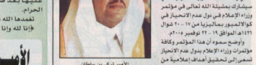
الأمير تركي بن سلطان

بهدف غرس النظام العالمي الجديد للإعلام والاتصال، بحيث يكون عنصراً هاماً لتحقيق التوازن في تدفق المعلومات الذي كان في الماضي يخدم فقط هيمنة الدول المتقدمة في مجال التجارة العالمية والنتائج الاقتصادية الأخرى. ونوه سمو مساعد وزير الثقافة والإعلام بدور مؤتمرات وزراء الإعلام في دول عدم الانحياز وقال أنها تقوم بدور هام كهيئة تخطط وتنفذ وتعامل مع المنظمات الدولية مثل الأمم المتحدة واليونسكو وقسم الإعلام العام في الأمم المتحدة ولجنة الأمم المتحدة للإعلام وجميع المنظمات الدولية الأخرى. واختتم سموه حديثه مؤكداً على اهتمام القيادة الرشيدة بقيادة خادم الحرمين الشريفين الملك عبدالله وسمو ولي عهده الأمين الأمير سلطان بن عبدالعزيز بوسائل الإعلام الداخلية وتعزيز التعاون بين وسائل الإعلام الخارجية في إطار التسلسل بالتعاليم والقيم الإسلامية كما أثنى سمو مساعد الوزير على الجهود الكبيرة والاهتمام المباشر من قبل معالي وزير الثقافة والإعلام الأستاذ آباد أمين ميني.