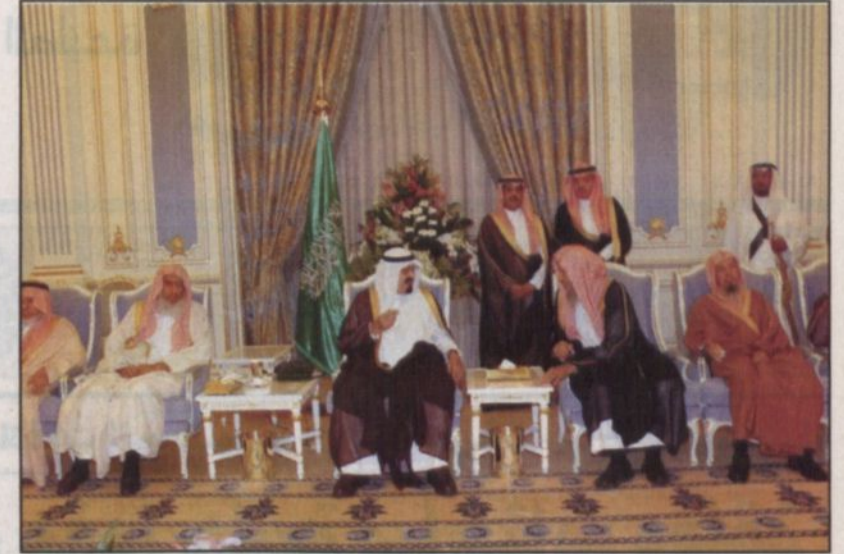
خادم الحرمين خلال الاستقبال