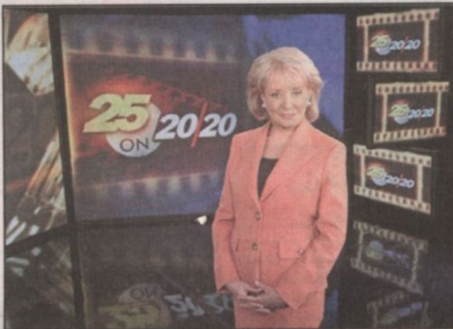
في استوديو (20/20)

موقفه هذا في مجلس الأمر وقالت زوجة باول أن هذا الأمر سيبقى معه طويلاً. في لقاءها الأخير مع الملك عبدالله والتي نشرت الصحف نصه كان الحوار مثيراً وقدم الكثير من الأفكار الجريئة والمهمة. مؤخراً ظهرت باربرا مع لقاء المذيعة أوبرا بعد إعلانها إعتزاًها الخروج عن برنامج (20/20) وتحدثت باربرا عن مبادئها المهنية وحياتها الخاصة