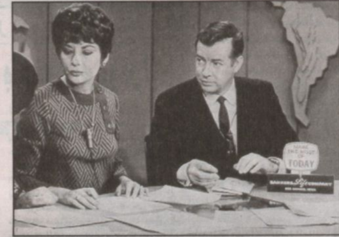
صورة قديمة لباربرا

منذ مدة حلقات البرنامج التي تشارك فيه باربرا والترز بعنوان (20/20) ومن خلال هذه اللقاءات يمكن أن تتعرف أكثر على باربرا. باربرا تلتقي مع زعماء دول ومجرمين وأشخاص قتلوا والديهم وترى أنها نفسها في كل الحلقات. إنها عبر صوتها المتكسر وعينيها الدامعتين وأسئلتها الصغيرة الدقيقة وتركيزها المشدود تمثل بشكل ما صوت الضمير الخاص بالشخص