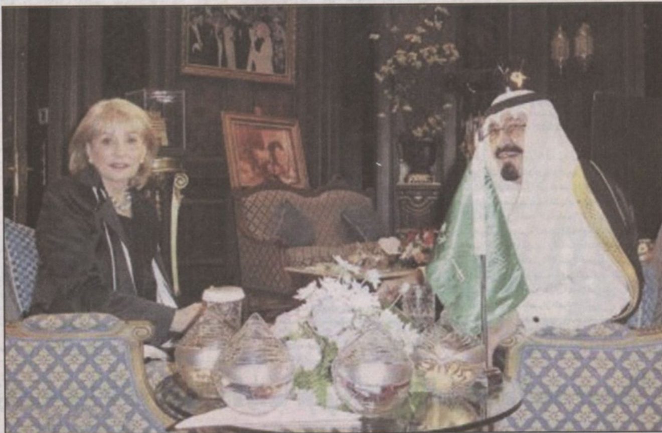
لقاؤها مع الملك عبدالله

صوت المذيعة الأمريكية باربرا وولترز متكسر وذو نغمة طفولية ولكن هذا الصوت الطفولي كشف الكثير من الحقائق والتحب أممته الكثير من الضيوف المشهورين وهم يعلنون عن أشياء يقولونها للمرة الأولى. بعض الضيوف قالوا عن لقاءاتهم مع باربرا أنك تشعر أنك تتحدث عن أشياء لم تكن تتوقع للملاك مايك تايسون قالت أثناء لقاء قديم مع باربرا بشكل غير متوقع إنه يقوم بإهانتها وضربها وعندما سألت بعد ذلك هل كانت معدة لقول مثل هذا الكلام قالت إنها لا تعرف كيف خرج منها مثل هذا الكلام القابع في أعماقها. ولكن يبدو بأنه ليس هناك سر غامض. السر يكمن في شخصية باربرا التي تعد من أهم وأعلى الشخصيات المحاور في الإعلام الأمريكي. بالإضافة إلى موهبة باربرا الشخصية التي ولدت معها إلا أنها تمتلك القدرة على الإنسجام العاطفي مع الشخص حتى تجعله يبوح بأشياء في منتهى السرية والخصوصية. تعرض القناة الرابعة mbc4