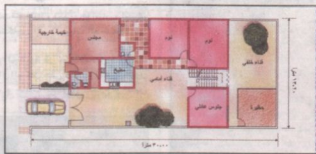
مسقط أفقي لوحدة سكنية بالمشروع

عادت الأسرة السعودية وتقاليدها.. وتضمن المشروع جميع المرافق من المساجد، والمدارس، ومركز الرعاية الصحية، والمركز الاجتماعي، كما تتوفر في المشروع كافة الخدمات الأساسية من الماء والكهرباء، وتمديدات الطرق والإنارة والرصف، كما سوف الهاتف والصرف الصحي، وشبكات الطرقات والإنارة والتدريب، وفرص التوعية، والتعليم، والترفيه، وفرص الإقراض والعمل، ليكون السكان - بحول الله - مواطناً منتجاً، وناقعاً لنفسه وأسرته ومجتمعه ووطنه.