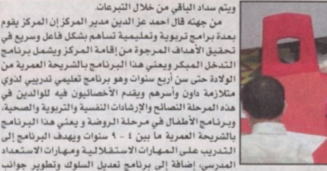
عدد من أطفال المركز

وعدا سعادة المهندس الجويسر الجهات والهيئات المختلفة إلى دعم المركز من أجل أن