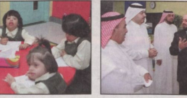
المهندس الجويسر خلال الزيارة