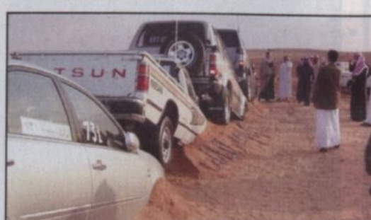
طريقة جديدة اتخذها الشباب لسيراتهم

الملك عبدالله. المسابقة الثالثة، الفحول لأحسن فحل. الرياض، تواجبت بالحدث ونقلت التواجد الكبير جداً حيث تحولت الصحراء في أم رقية الى مدينة متكاملة الخدمات حيث انتشرت الاسواق والمطاعم والمغاسل وتأجير الخيام والمسالخ. كما تحول هذا التواجد الى استعراض الحضور بالسيارات والديابات فيما شكل السوق الرئيسي لبيع الابل اهتمام الحضور الذي تجاوز عددهم في نهاية الاسبوع الماضي الى حوالي ٣٠ الف شخص جاءوا للاستمتاع بالأجواء الريفية الممطرة في صحراء أم رقية وكان لمتابعة امانة مدينة حفر الباطن دور فعال في تنظيم السوق والاشراف