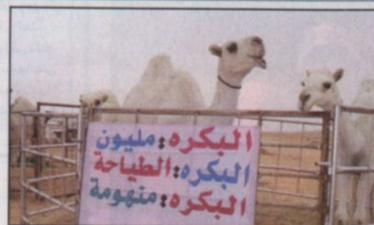
دعابة لاسماء عدد من البكرات