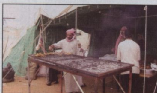
مطعم آخر لتقديم المشويات