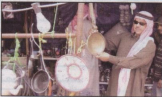
محل بيع الاواني القديمة