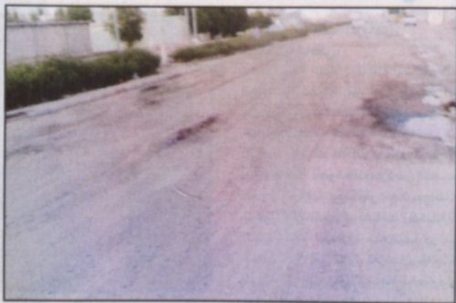
شارع رئيسي تغطت معالمه