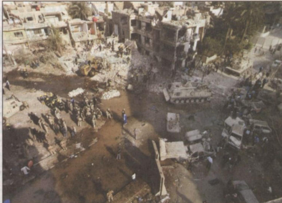
مشهد لتويع الدمار الذي أصاب فندقاً في بغداد ومبنى لوزارة الداخلية العراقية.