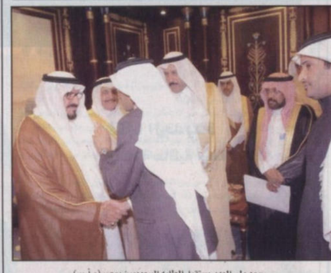
سمو ولي العهد يستقبل الطلبة السعوديين بمصر (و.أ.س)