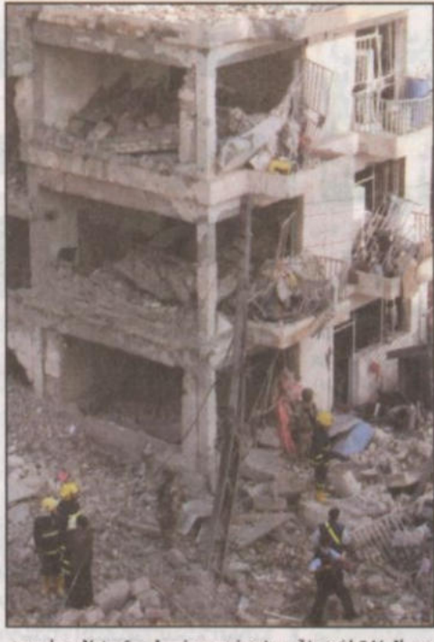
عمال انقاذ عراقيون عند مبنى لحق به الدمار بعد انفجارين انتحاريين في بغداد.