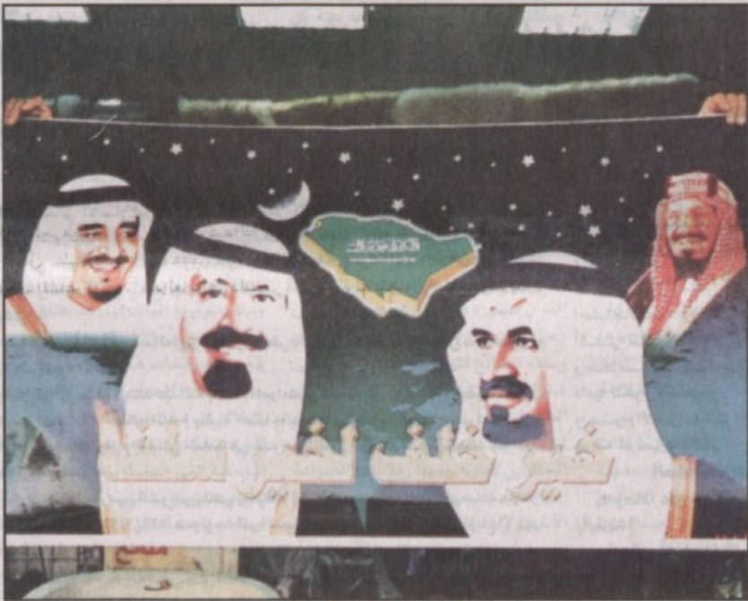
خير خلف لخبر سلف شعار يحمل صورة المؤسس والملك فهد والملك عبدالله وولي العهد الأمير سلطان

ويضيف الشيخ الحقباني: بايعنا الملك فيصل رحمه الله ثم حضرت مبايعة الملك خالد رحمه الله وأقام أهالي منطقة الرياض حفلاً للملك فهد بن عبدالعزيز يرحمه الله في استاد الأمير فيصل بن فهد بن عبدالعزيز بالمز وكنت مسؤولاً عن جمع تبرعات الأهالي بتوجيهات من صاحب السمو الملكي الأمير سلمان بن عبدالعزيز أمير منطقة الرياض حيث أهدى أهالي منطقة الرياض للملك فهد هدية تتمثل في بناء مكتبة الملك فهد الوطنية.