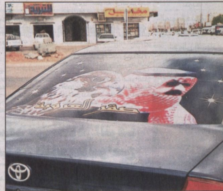
صقر العروبة أكثر الصور انتشاراً