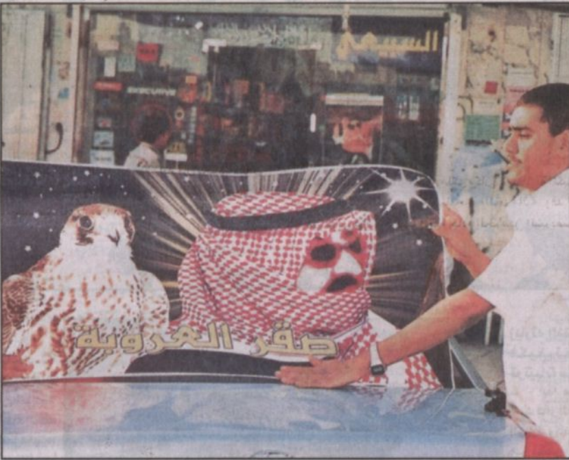
شاب يقوم بتعليق صورة خادم الحرمين على سيارته