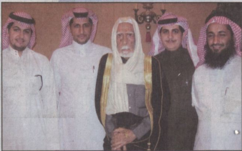
الحقباني يتوسط عدداً من الأبناء والأحفاد

حفل الملك سعود أقيم في صحراء المز.. وتبرع الأهالي بـ ٢٠٠ ألف ريال لإقامته