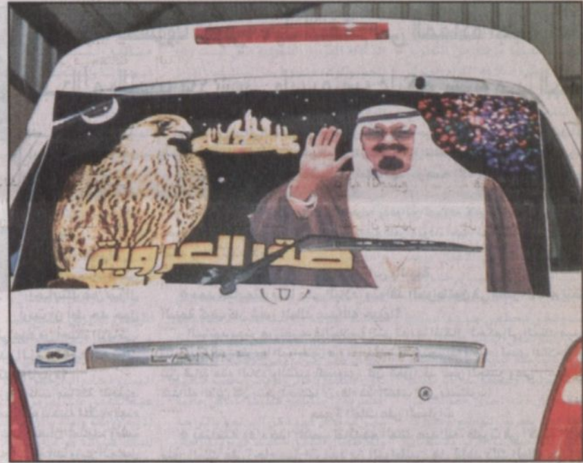
أحد الشعارات التي تحمل صور خادم الحرمين الشريفين