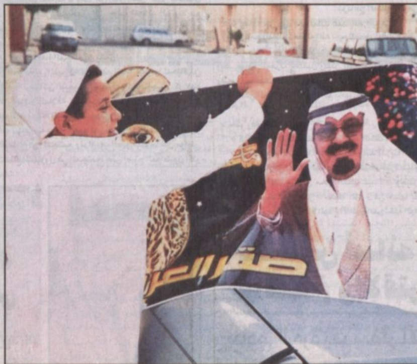
أحد الأطفال يقوم بتعليق صورة خادم الحرمين الشريفين على سيارة والده