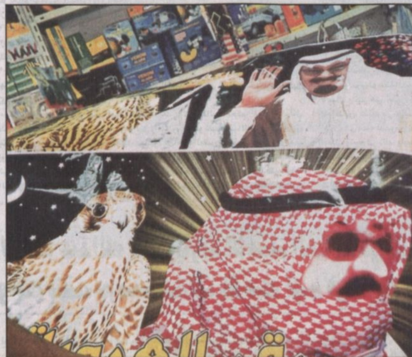
لمناخ مختلفة لصور خادم الحرمين الشريفين

ترجم العديد من المواطنين مشاعرهم الوطنية بالبيعة الصادقة لخادم الحرمين الشريفين الملك عبدالله بن عبدالعزيز حيث اختار البعض منهم بطريقته الخاصة التعبير عن مشاعره بتلك البيعة وبمناسبة احتفال أهالي الرياض باستقبال خادم الحرمين الشريفين من خلال تعليق الصور المعبرة عن الولاء والطاعة لخادم الحرمين الشريفين على سياراتهم الخاصة وهم يجوبون شوارع الرياض حيث زاد الاقبال على تعليق تلك الصور خلال الايام التي سبقت احتفال أهالي