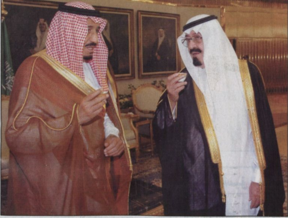
الملك عبدالله وحديث مع الأمير سلمان لدى وصوله الرياض.

سعود وصاحب السمو الملكي الأمير بدر بن عبدالعزيز نائب رئيس الحرس الوطني وصاحب السمو الملكي الأمير سلمان بن عبدالعزيز أمير منطقة الرياض وأصحاب السمو الملكي الأمراء وأصحاب المعالي الوزراء وكبار المسؤولين من مدنيين وعسكريين وجمع من المواطنين. ووصل في معية خادم الحرمين الشريفين كل من صاحب السمو الملكي الأمير متعب بن عبدالعزيز وزير الشؤون البلدية والقروية وصاحب السمو الملكي الأمير نايف بن عبدالعزيز وزير الداخلية وصاحب السمو الملكي الأمير فيصل بن عبدالله بن محمد آل سعود مساعد رئيس الاستخبارات العامة وصاحب السمو الملكي الأمير بندر بن سلطان بن عبدالعزيز الأمين العام