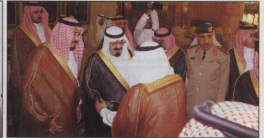
خادم الحرمين يصافح مستقبليه لدى وصوله الرياض