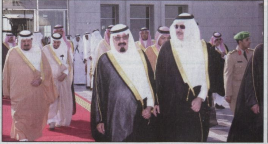
خادم الحرمين معادراً جدة