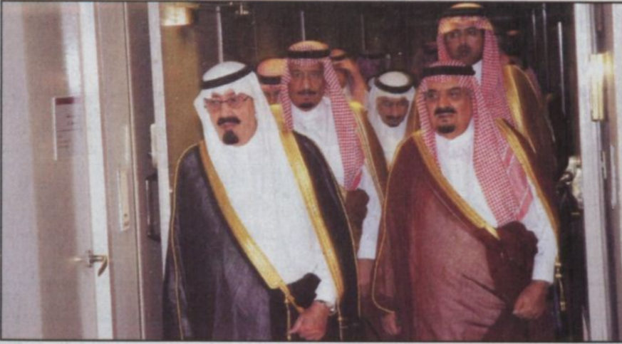
وصول الملك عبدالله الى الرياض