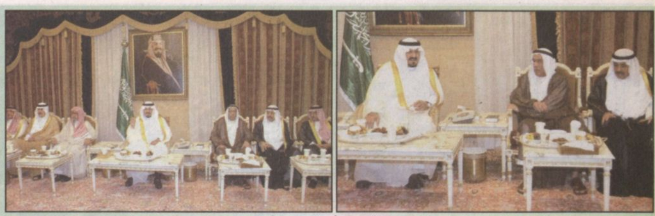
الامير سلطان خلال استقباله مستشار أمير دولة الكويت وعددًا من المسؤولين وأعيان الكويتيين

عمليّة دخول وخروج المصلين وترتيب صفوف المصلين وتوفير عربات السعي المجانية والمخصصة لكبار السن والعجزة كما قامت الرئاسة بنشر العديد من الدعاة والوعاظ لتقديم النصح الديني لضيوف الرحمن داخل المسجد الحرام بالإضافة إلى توزيع العديد من المصاحف والمصحف الشريف والمصحف الشريف في شكل مطبوعات لتسهيل عملية الدخول والخروج من صحن المطاف عند مداخل المسجد الحرام والممرات لتنظيم