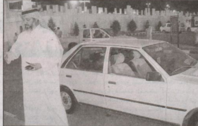
مواطن يقدم سيارته لمتضرري الزلزال