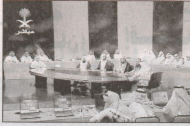
استديو الحملة في التلفزيون