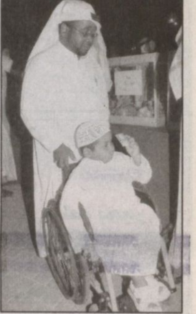
موق يشارك في حملة الخير

كما تبرع صاحب السمو الملكي الأمير نايف بن عبدالعزيز وزير الداخلية الشريف العام على الحملة الشعبية السعودية لمساعدة متضرري زلزال باكستان بمبلغ ثلاثة ملايين ريال للمساهمة في عون المتضررين من كارثة الزلزال. وتبرع صاحب السمو الملكي الأمير سلمان بن عبدالعزيز أمير منطقة الرياض بمبلغ مليون ريال. وتبرع صاحب السمو الملكي الأمير أحمد بن عبدالعزيز نائب وزير الداخلية بمبلغ مليون ريال عنه وعن ابنته. فيما تبرع صاحب السمو الملكي الأمير عبد المجيد بن عبد العزيز أمير منطقة مكة المكرمة بمبلغ مليون ريال. فيما قدم عدد من أصحاب السمو الملكي الأمراء ورجال الأعمال والتبرعات المالية والعينية، وتجاوز إجمالي التبرعات حتى صباح اليوم