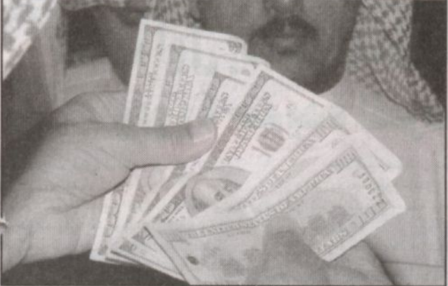
جانب من التبرعات