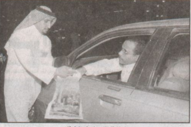
استقبال التبرعات في الطرقات

خادم الحرمين افتتح التبرعات بـ (١٠ ملايين ريال وولي العهد قدم (٥ ملايين.. والحصيلة تتجاوز (١٢١) مليون ريال