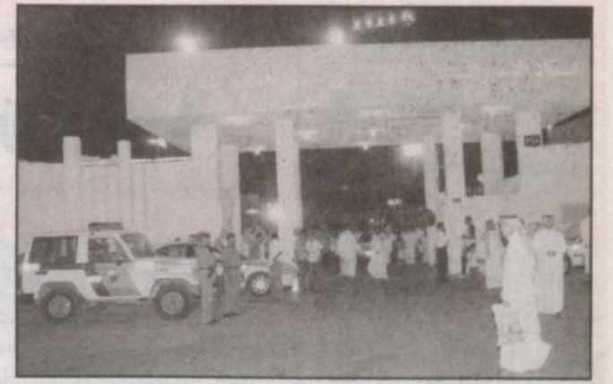
مدخل استاد الأمير فيصل بن فهد اكتظ جمع المتبرعين