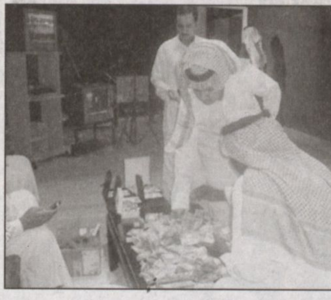
جانب من حملة التبرعات

تبوك - عودة المطوي، افتتح صاحب السمو الملكي الأمير فهد بن سلطان أمير منطقة تبوك حملة التبرعات لمتضرري الزلزال بباكستان الشقيقة بالتبرع بمليون ريال، وذلك استجابة لتوجيهات خادم الحرمين الشريفين الملك عبدالله بن عبدالعزيز - حفظه الله - لدعم متضرري الزلزال بباكستان. وتوافد إلى مقر التلفزيون بمدينة تبوك عدد كبير من المواطنين لتقديم تبرعاتهم النقدية والعينية. وقد قام عدد من المسنين والأطفال والنساء بتقديم تبرعاتهم كما قدمت النساء حليهن وتنوعت التبرعات من مواد عينية وملابس وأغطية وخيام، كما قدم أحد المواطنين جملًا للجنة التبرعات، وازدحم طريق الملك عبد العزيز المقابل لمستشفى الملك خالد والمتجه إلى مبنى التلفزيون بالمواطنين الذين تسابقوا للتبرع.