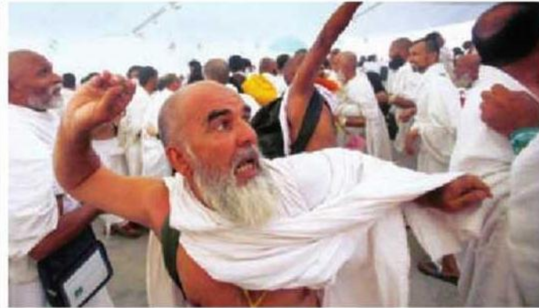
رجل منى أثناء رمي جمرة العقبة، (واس)