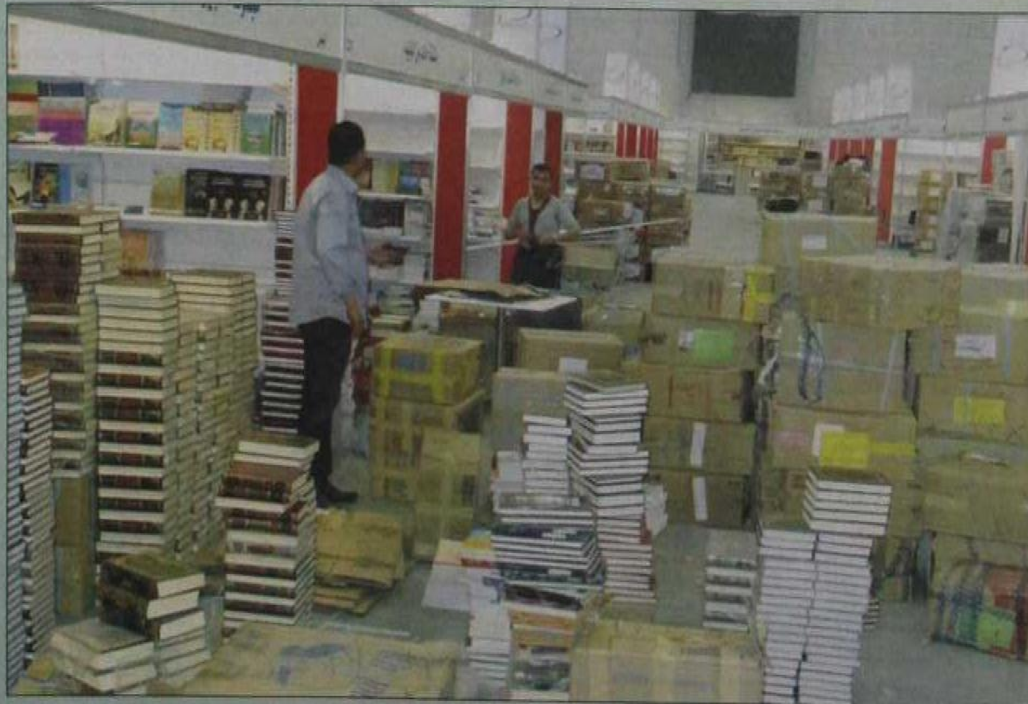
هكذا ظهرت الاستعدادات الأخيرة لأكثر من 1700 عارض

التاريخ: 2014-03-04 رقم العدد: 16689 رقم الصفحة: 34 مسلسل: 184 رقم القصة: 2