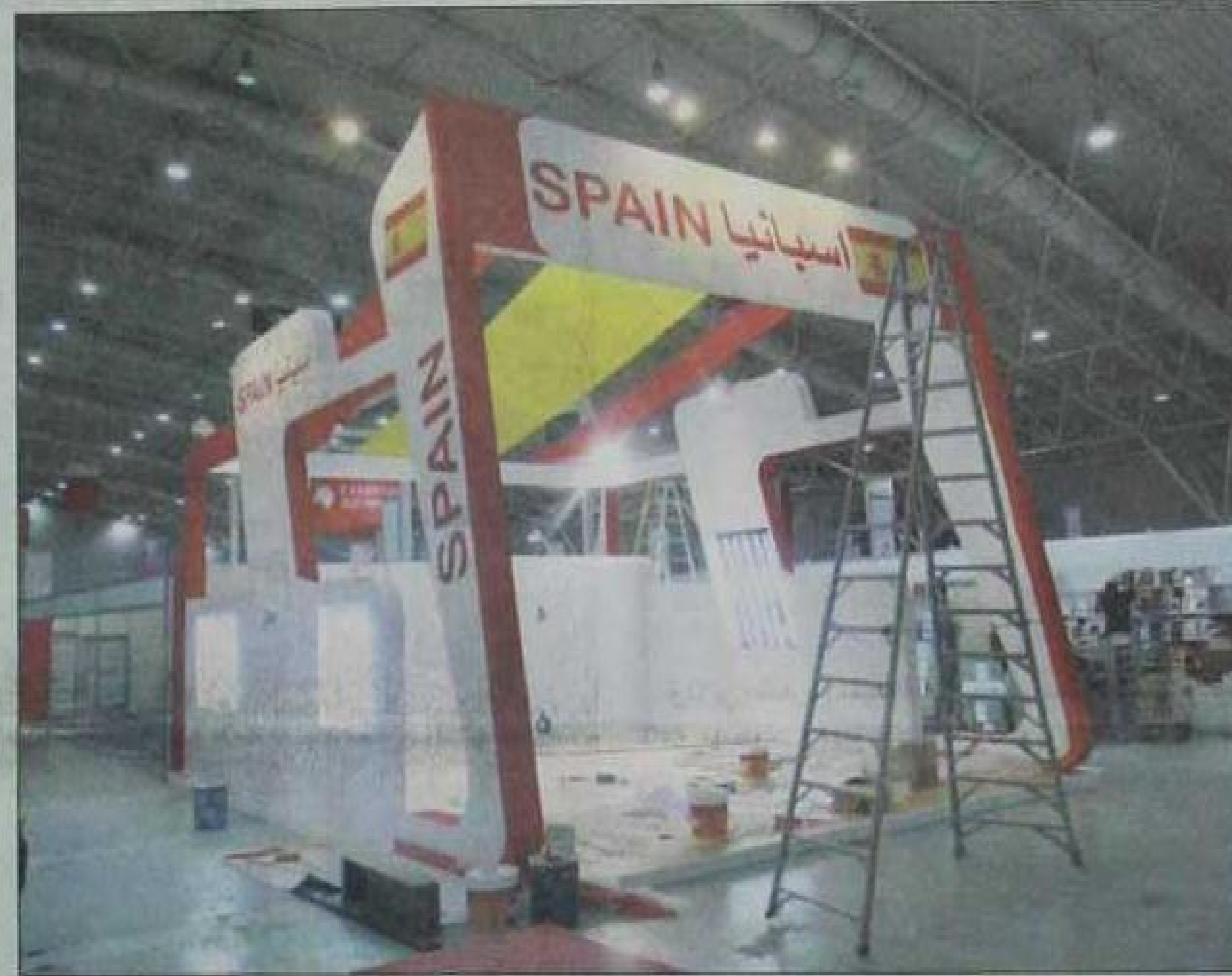
المقر المخصص لـ «ضيف الشرف» مملكة إسبانيا