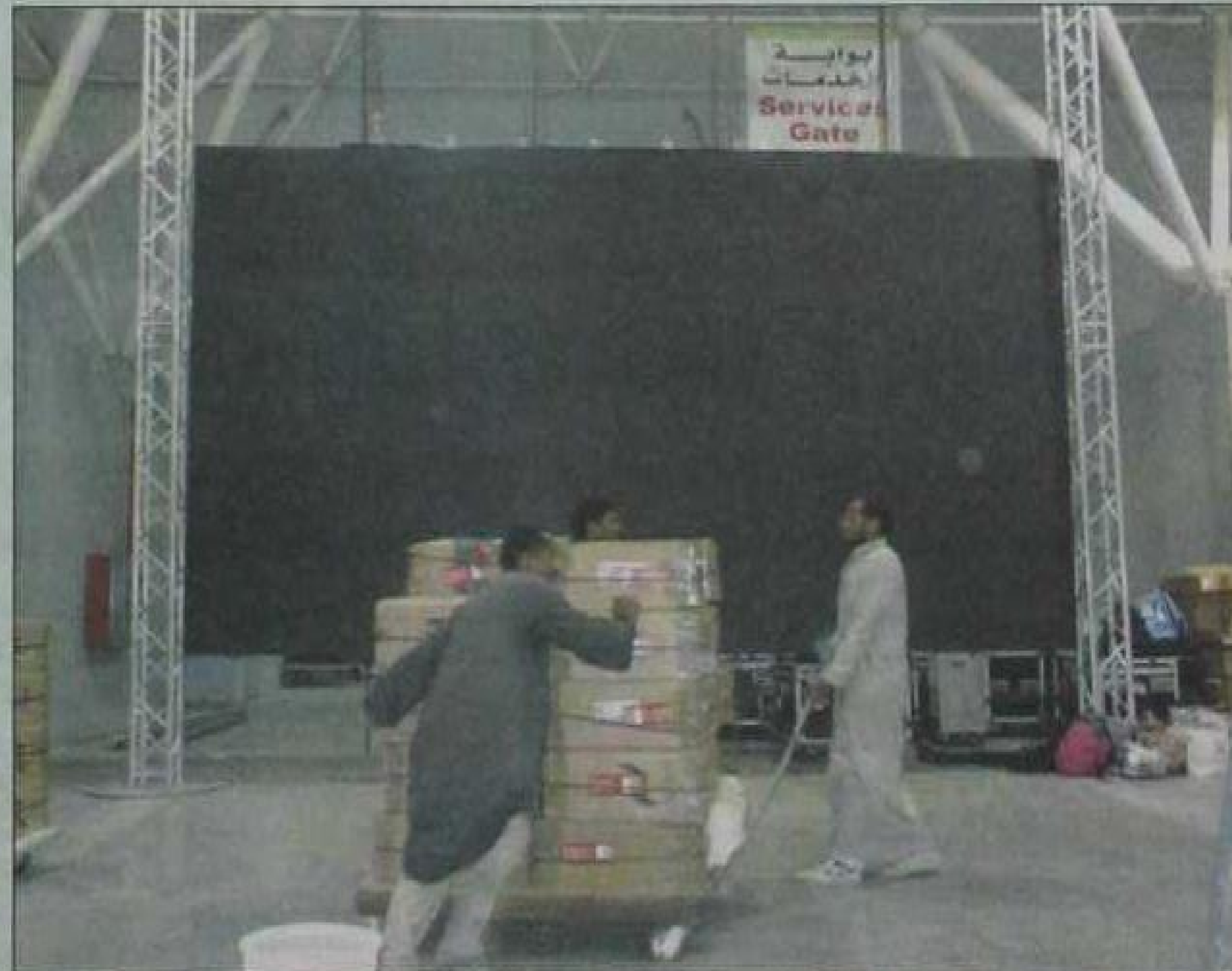
عاملان يمران أمام إحدى شاشات العرض الرئيسة قبل رفعها