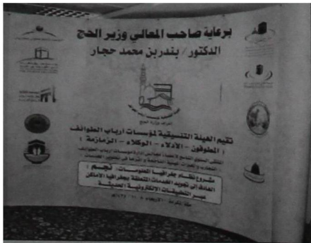
صورة من الملتقى السنوي التاسع ١٤٣٥ هـ

التاريخ: 2014-09-28 رقم العدد: 16897 رقم الصفحة: 34 مسلسل: 130 رقم القصاصة: 5