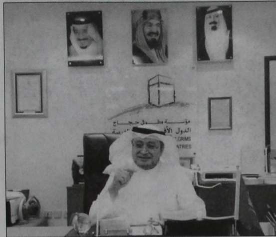
عبدالواحد بن برهان الدين رئيس الهيئة التنسيقية لمؤسسات أرباب الطوائف

شراكات استراتيجية مع بيوت خبرة أكاديمية متخصصة «الجامعة الإسلامية - جامعة طيبة - الإدارة العامة للتربية والتعليم - مركز قطاف للتدريب لتطوير المهارات والقدرات لدى العاملين الدائمين والموسميين أبرز المستجدات خلال موسم ١٤٣٥هـ • عمل برنامج جديد لتشكيل مجموعات الخدمة الميدانية والترشيح للعمل الموسمي يتماشى مع طبيعة وتطلعات المؤسسة