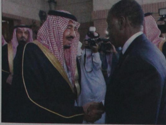
الأمير سلمان يتقابل الأحاديث مع الرئيس الحسن واثارا