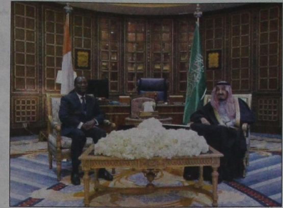
الأمير سلمان خلال جلسة المباحثات مع الرئيس الحسن واثارا

أقام نيابة عن خادم الحرمين مأدبة غداء تكريماً للرئيس الحسن واثارا