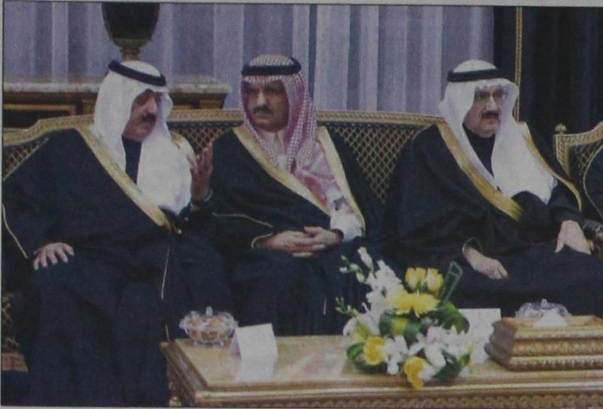
الأمير متعب بن عبدالله والأمير خالد بن بنتر والأمير منصور بن متعب خلال المناسبة