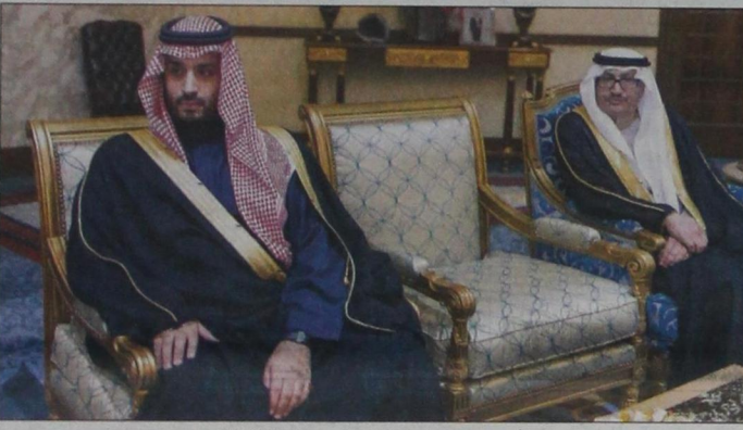
الأمير محمد بن سلمان خلال حضوره جلسة المباحثات