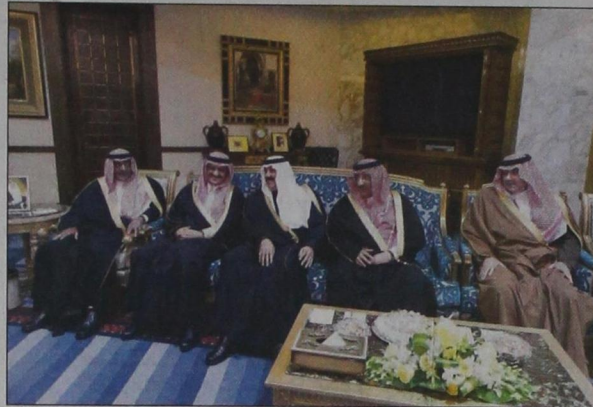
الأمراء مقرن وخالد بن بنتر ومتعب بن عبدالله ومحمد بن نايف والعزير بن عبدالله