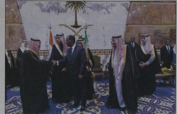
الأمير مقرن يصافح رئيس كوت دي فوار