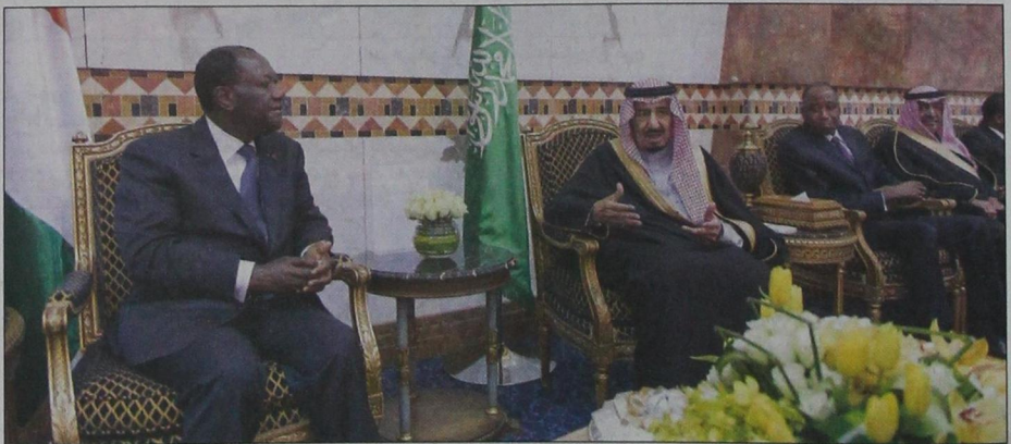
ولي العهد خلال مأدبة الغداء

فيما حضره من الجانب الكوتي فوار محالي وزير