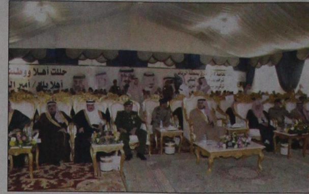
أمير الرياض راعياً راعياً حفل التشييد

دشن مراكز أمن الطرق في ضرما وممرات وشقراء