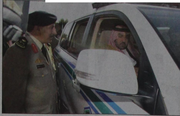
الأمير تركي بن عبدالله يتفقد التقنية الحديثة في مركبات أمن الطرق