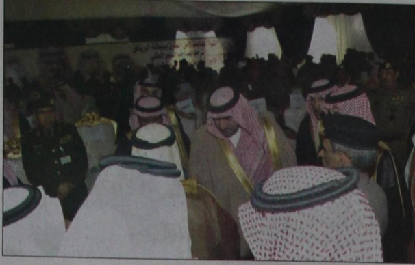
سموه مصافحاً المستقبليين

التاريخ: 2014-12-12 رقم العدد: 16972 رقم الصفحة: 3 مسلسل: 17 رقم القصة: 1