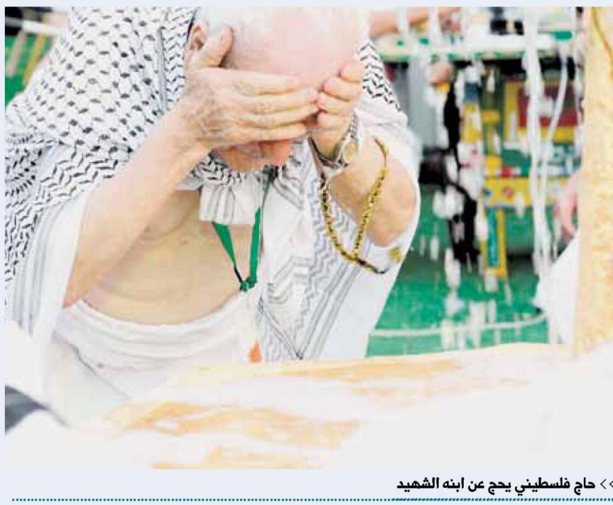
<< حاج فلسطيني يحج عن ابنه الشهيد

والمسجد الاقصى محرراً، داعياً الفلسطينيين الى التوحد للعودة صفا واحداً لمواجهة العدو الاسرائيلي. وقال الحاج