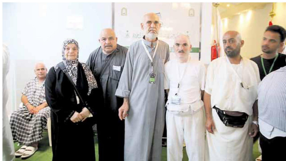
<< حجاج من فلسطين يتحدثون لـ «اليوم»