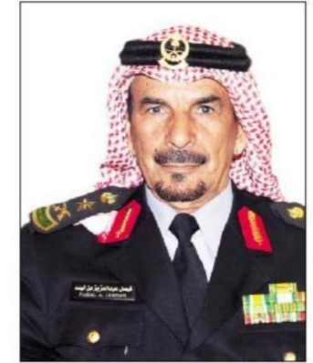
الفريق فيصل بن لبة

◆ اللواء الزهراني: يوم الوطن ثوابت راسخة لها جذور في أعماق التاريخ واسترجاع فصول ملحمة رائعة