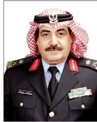
اللواء بندر بن خثلة