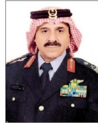
اللواء راشد الزهراني