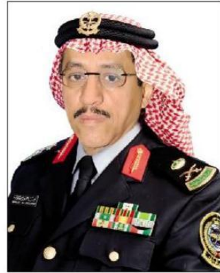
اللواء مساعد الشلهوب