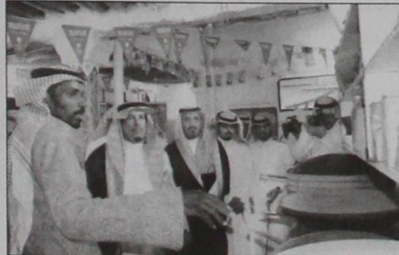
المحافظ يتجول في أحد المعارض التراثية