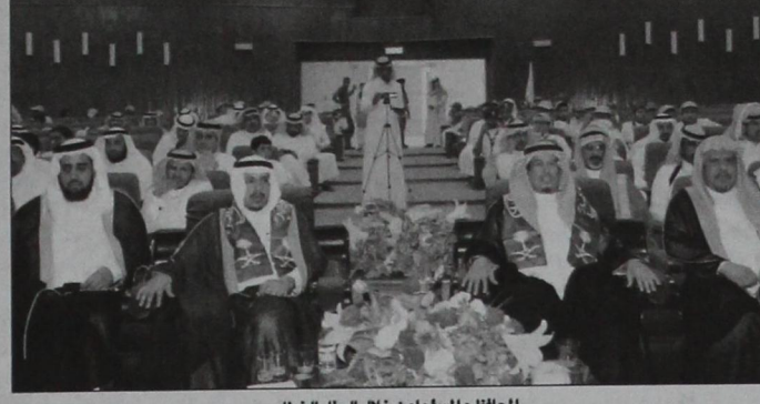
المحافظ والمسؤولون خلال الحفل الخطابي