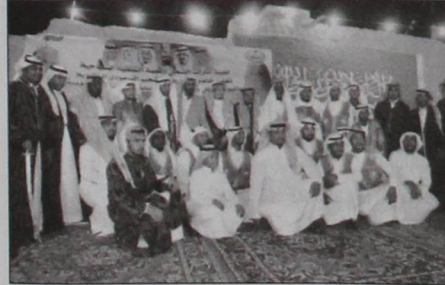
المحافظ يتوسط أعضاء فرقة التراث الشعبي