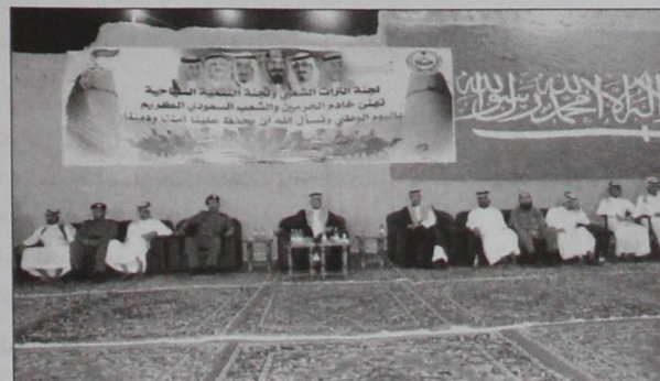
جانب من حضور الاحتفالية الشعبية باليوم الوطني