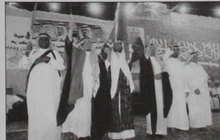
أل حسين مشاركا في العرضة السعودية