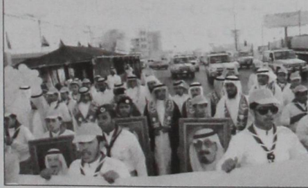
جانب من المسيرة