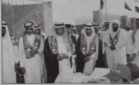
المحافظ ومدير التعليم خلال المسيرة الاحتفالية