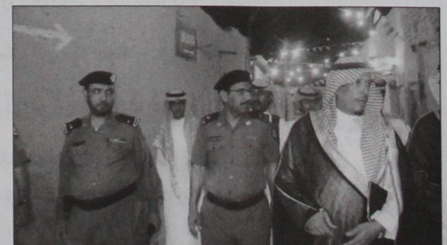
جانب من جولة المحافظ خلال الاحتفال