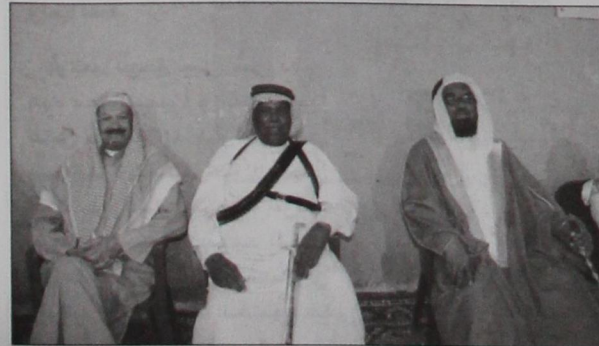
مواطنون حرصوا على المشاركة في احتفالات اليوم الوطني