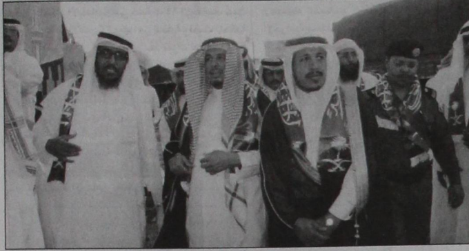
المحافظ متقدماً مسيرة الإحتفال

المناسبة عظيمة تتذكر فيها الأجيال قصة كفاح المؤسس طيب الله ثراه