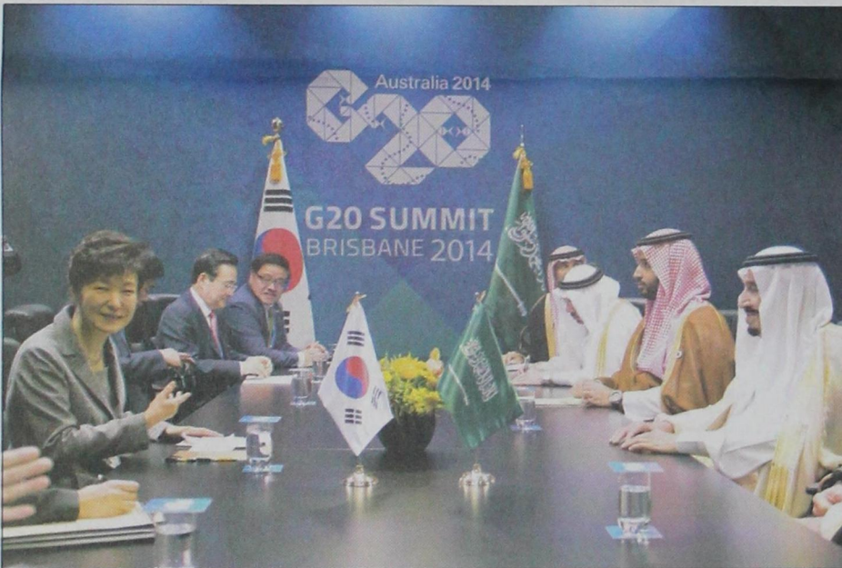
الأمير سلمان في اجتماع مع رئيس كوريا الجنوبية في اليوم الثاني من أعمال قمة العشرين.