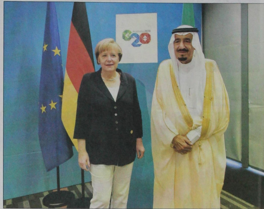
سمو ولي العهد الأمير سلمان خلال لقاء بالمستشارة الألمانية انجيلا ميركل (واس)