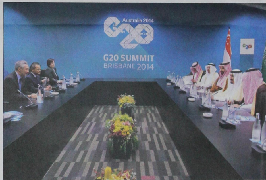
الأمير سلمان خلال جلسة المباحثات مع وزراء سنغافورة.