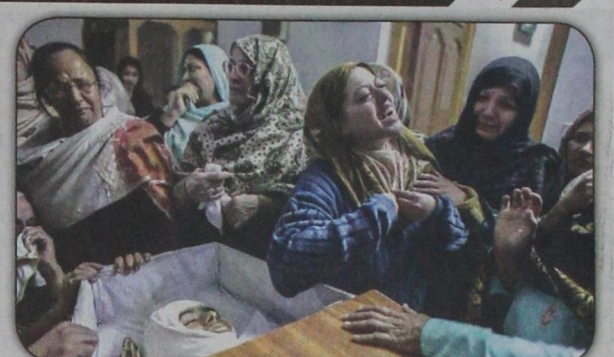
نساء ينتحبن حول جثمان طالب قتل في هجوم إرهابي شنته طالبان، على مدرسة في بيشاور وأدى إلى مصرع ١٤٢ تلميذاً و٩ مدرسين (رويترز- ١٦ ديسمبر)