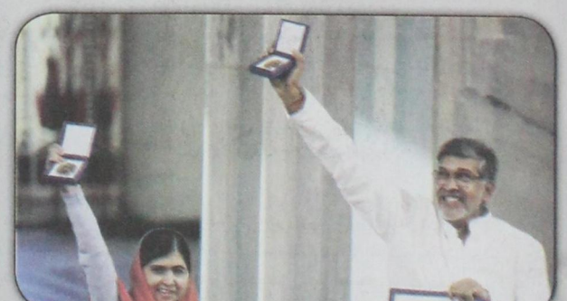
ملاحة يوسفزاي وكايلاش ساتياراثي في لقطة بعد تسليمهما جائزة نوبل للسلام مناصفة في أوسلو (١٠ ديسمبر)