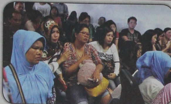
أفراد عوائل طائرة الركاب الماليزية «كيو زد ٨٥٠١»، ينتحبون بعد اختفائها خلال رحلتها بين اندونيسيا وسنغافورة وعلى متنها ١٦٢ شخصاً في ثالث كارثة تعنى بها ماليزيا خلال عام (رويترز- ٢٨ ديسمبر)