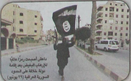
داعش أصبحت رمزاً عالمياً للإرهاب الأبيض بعد إقامة دولة خلافة على الحدود السورية العراقية (٢٩ يونيو)