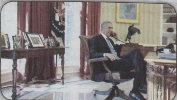
الرئيس أوباما يتحدث هاتفياً مع ميغويل إني كويبا عقب إعادة العلاقات الدبلوماسية مع هالاندا بعد ٥٠ عامًا من القطيعة (رويترز ١٧ ديسمبر)