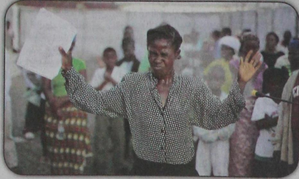
امراة يتم رشها بالمطهرات وهي تغادر مركزاً للعلاج الإبيولا في منروفيا بليبيريا (٣٠ سبتمبر) وبلغت الوفيات بالمرض في سيراليون وليبيريا وغينيا، ٤٧٤٧ شخصاً حتى ٢١ ديسمبر