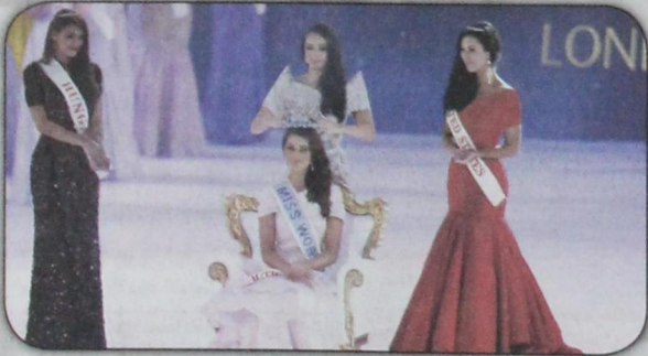
ملكة جمال أفريقيا رولين شتراوس بين وصيفتها لدى تتويجها ملكة لجمال العالم ٢٠١٤ في لندن (١٤ ديسمبر)