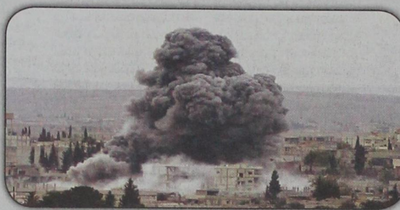
واحدة من الهجمات التي شنها التحالف الدولي ضد الإرهاب في بلدة كوياني (٢٣ سبتمبر)