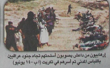
إرهابيون من داعش يصوبون أسلحتهم تجاه جنود عراقيين باللباس المدني تم أسرهم في تكريت (١٤ يونيو)