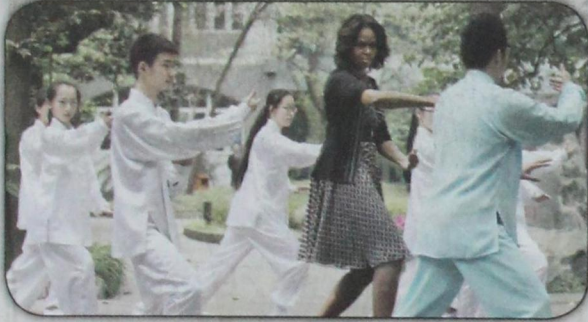
سيدة أميركا الأولى ميشيل أوباما تتدرب على رقصه بتاي شاي، مع طلاب صينيين في شينغدو بجنوبي الصين (أب- ٢٥ مارس)