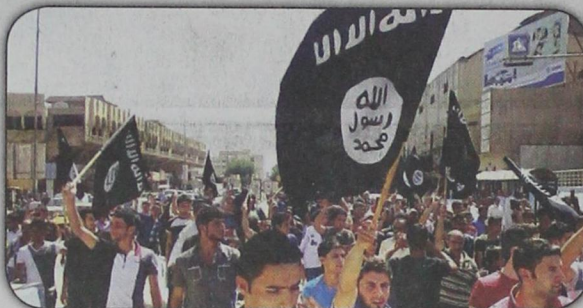
أنصار داعش استخدموا وسطاء لتقديم حوافز مالية لتشجيع فتيات المدارس المراهقات للسفر إلى مناطق القتال والاقتران بالمقاتلين