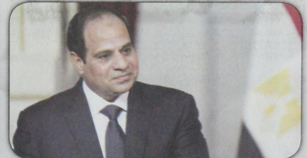
إعلان فوز عبدالفتاح السيسي رئيسًا لجمهورية مصر العربية (أ ف ب- ٤ يونيو)