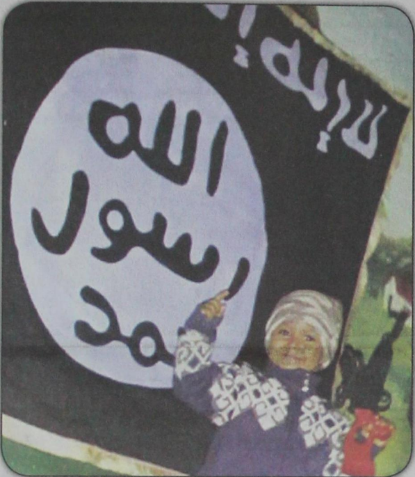
لقطة لطفل مع بندقيّة لعبة يقف أمام علم لتنظيم داعش الإرهابي، الصورة نشرتها أرملة احد مقاتلي داعش