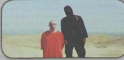
الصحفي الأميركي جيمس فوللي الذي زعم تنظيم داعش إعدامه نجحاً في سوريا (أ ب - ١٩ أغسطس)