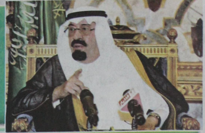
خادم الحرمين حذر من مخاطر نفسي الإرهاب وقاد الحرب العالمية ضده

ومن بين أهم جهود المملكة أيضا في الحرب على هذه الآفة انعقاد المؤتمر