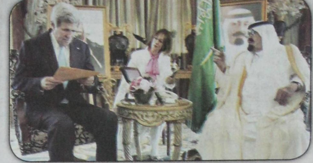
الملك عبدالله استقبل وزير الخارجية الأميركي كيري في ٥ يناير و٢٧ يونيو للتفكير حول مكافحة الإرهاب