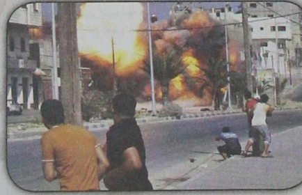
قنبلة إسرائيلية تدمر منزلاً في غزة خلال الحرب التي استمرت ٥٠ يوماً منذ ٨ يوليو وأسفرت عن مقتل ٢٢٠٠ فلسطيني