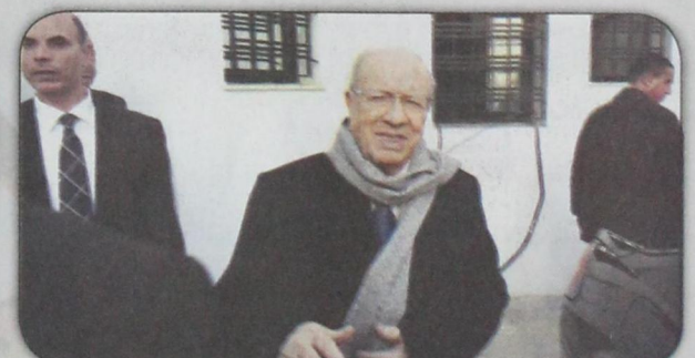
الباجي قائد السبسي يصل مقر حزبه بعد فوزه بالرئاسة في تونس (أ ف ب- ٢٢ ديسمبر)