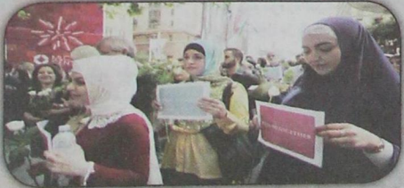
نساء مسلمات يتضامن حداداً على ضحايا الحصار الإرهابي للقوى في سديني