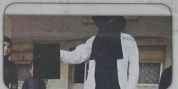
صورة نشرتها الإرهابية أقصا محمد في مطلع هذا العام وهي تحمل رأس رجل سوري أعدمه تنظيم داعش في سوريا