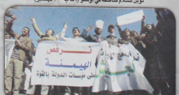
يمنيون يتظاهرون احتجاجاً على سيطرة الحوثيين على بعض المدن اليمنية الرئيسية ويطالبون بالقضاء على الفوضى والإرهاب (١٣ ديسمبر)