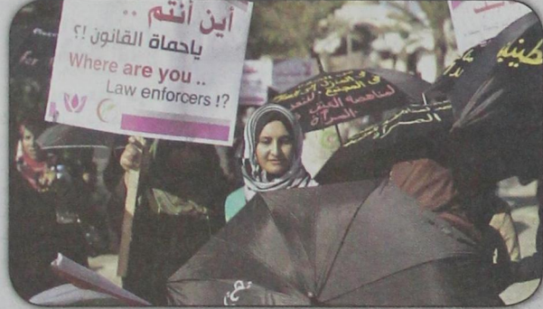
نساء فلسطينيات يشاركن في تظاهرة في غزة بمناسبة اليوم العالمي لحقوق الإنسان (أ ب - ١٠ ديسمبر)