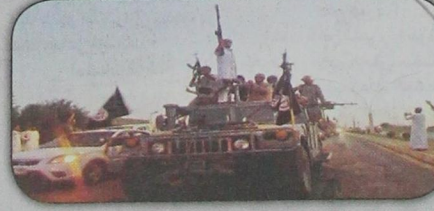
قوات من تنظيم داعش الإرهابي تستعرض قوتها في الموصل (أ ب - ٢٢ يونيو)