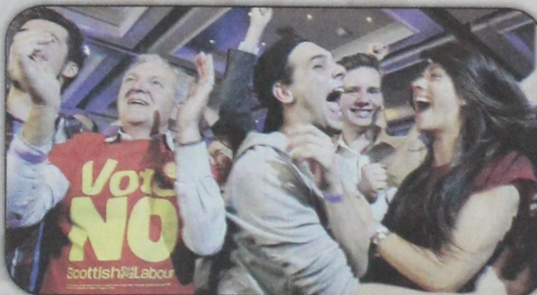
اسكتلنديون يحتفلون بنتيجة الاستفتاء الرافضة للاستقلال والبقاء ضمن بريطانيا العظمى تحت شعار، الأفضل معاً، (أ ف ب- ١٩ سبتمبر)