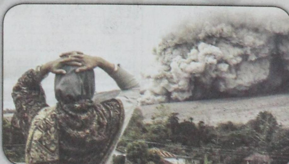
انفجار بركاني على سفح جبل في ولاية كاليفورنيا في ٣ نوفمبر