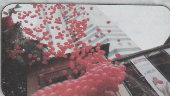
ناشطون يطلقون بالونات حمراء احتفالاً باليوم العالمي للايدز في مستشفى بساو باولو بالبرازيل (١ ديسمبر)