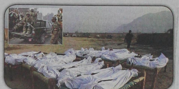
عناصر من طالبان قتلتهم القوات الباكستانية انتقاماً لمقتل ١٤٢ طالباً بمدرسة في بيشاور