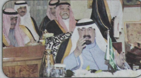
الملك عبدالله يلتقي قادة دول مجلس التعاون الخليجي حيث اتفقوا على مواجهة الخطر المتنامي من داعش في سوريا والعراق (١٦ نوفمبر)