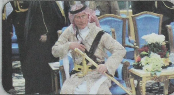
ولي العهد البريطاني الأمير تشارلز يشارك في العرضة السعودية بالزي الوطني السعودي بمهرجان الجنادرية بالرياض (أب- ١٨ فبراير)