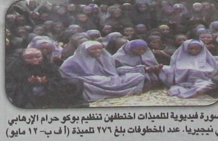
صورة فيديو لتلميذات اختطفهن تنظيم بوكو حرام الإرهابي في نيجيريا. عدد المخطوفات بلغ ٢٧٦ تلميذة (أ ب - ١٢ مايو)