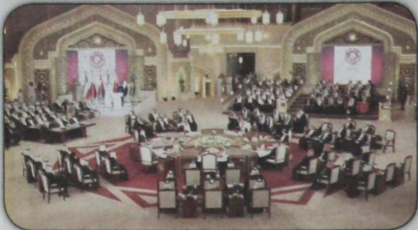
زعماء دول مجلس التعاون الخليجي يجتمعون في الدوحة (٩ ديسمبر)