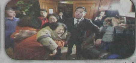
قريبة أحد ركاب الطائرة الماليزية دام انتش ٢٧٠، تنتحب في كين بعد إبلاغها بأخر التطورات عن الطائرة المفقودة وعلى متنها ٢٣٩ راكبا (أ ب - ٨ مارس)