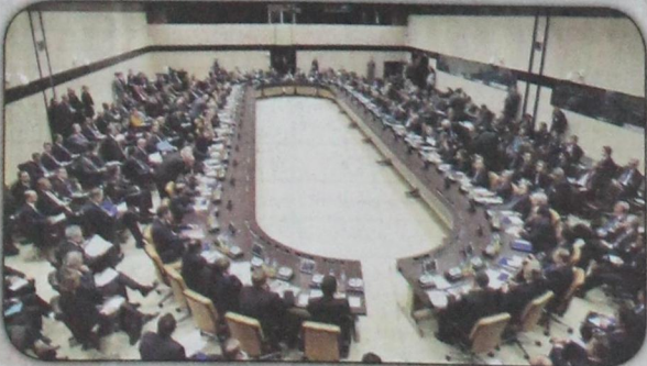
وزراء و مندوبو الدول الستين الأعضاء في التحالف الدولي ضد داعش يجتمعون في بروكسل (أ ف ب- ٣ ديسمبر)