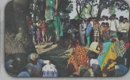
قرويون هنود يتحلقون حول جثتي شقيقين تتدليان من شجرة بعد تعرضهما للاغتصاب والقتل من قبل مهاجمين من بينهم رجال شرطة (أ ب - ٢٨ مايو)