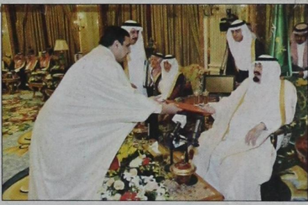
السفير التونسي يسلم أوراق اعتماده