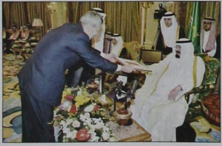
سفير جمهورية تركيا يسلم أوراق اعتماده (و.ا.س.)