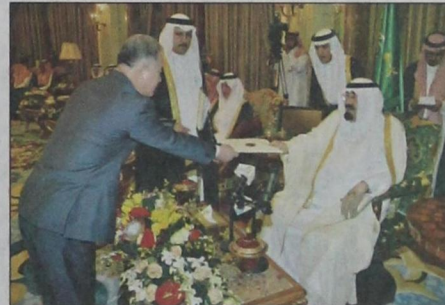
سفير جمهورية كوريا يسلم أوراق اعتماده