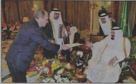
سفير نيوزيلندا يسلم أوراق اعتماده