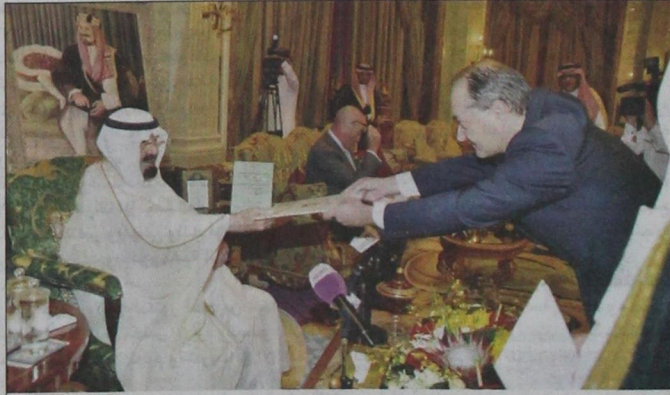
سفير جمهورية النمسا يقدم اوراق اعتماده