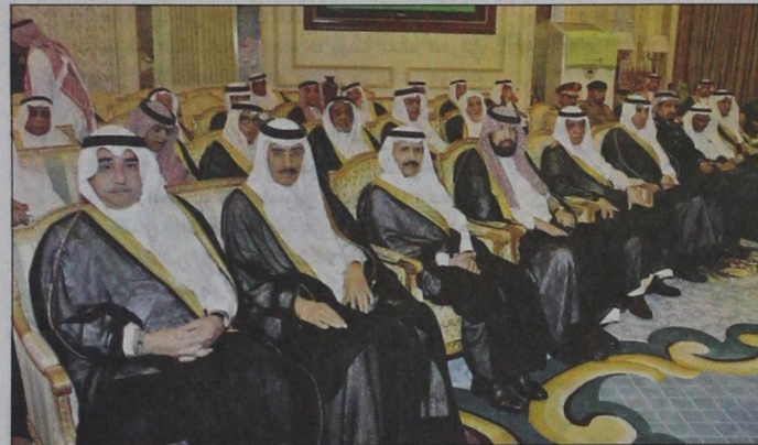
عدد من كبار المسؤولين خلال الاستقبال