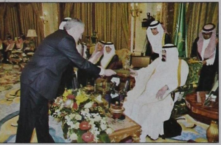
السفير البرازيلي يسلم أوراق اعتماده