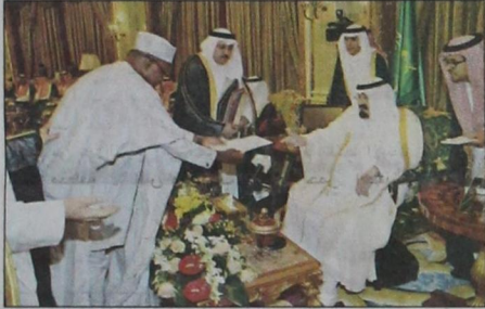
سفير جمهورية النيجر يقدم أوراق اعتماده

أن ننقل تحيات حكوماتنا لمقامكم الكريم . حضر مراسم تسليم أوراق الاعتماد صاحب السمو الملكي الأمير خالد الفيصل بن عبدالعزيز وزير التربية والتعليم وصاحب السمو الملكي الأمير سعود الفيصل وزير الخارجية وصاحب السمو الأمير فيصل بن محمد بن سعود الكبير وصاحب السمو الملكي الأمير مقرن بن عبدالعزيز آل سعود ولي ولي العهد النائب الثاني لرئيس مجلس الوزراء المستشار والمبعوث الخاص لخادم الحرمين