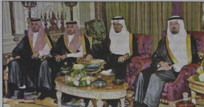
أصحاب السمو الملكي الأمراء خلال حفل استقبال السفراء