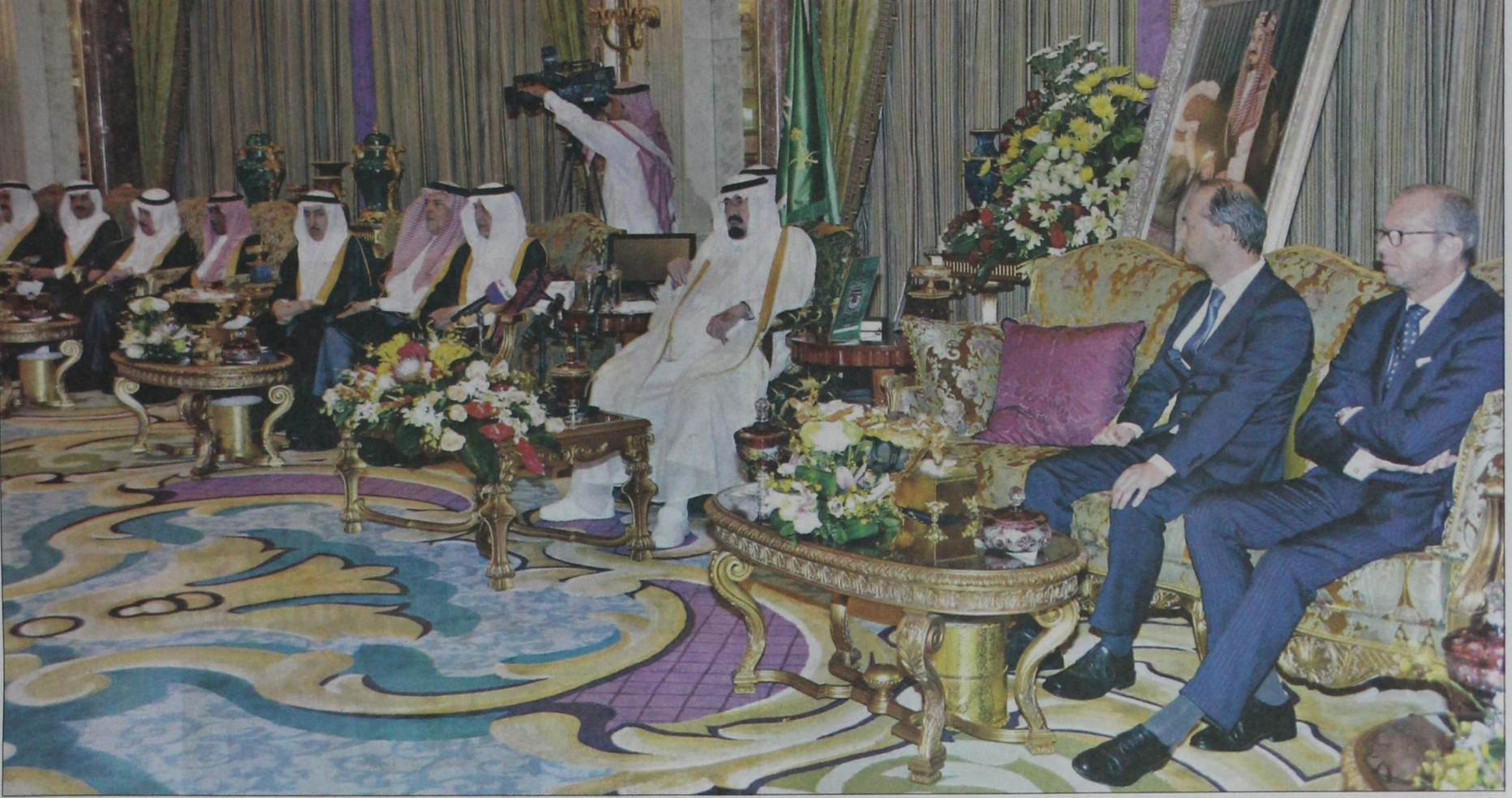
خادم الحرمين خلال تسلمه أوراق اعتماد السفراء