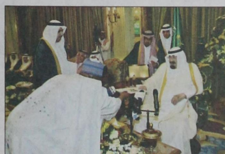
سفير جمهورية بنين يسلم أوراق اعتماده