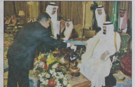
الملك يتسلم أوراق اعتماد سفير كازخستان