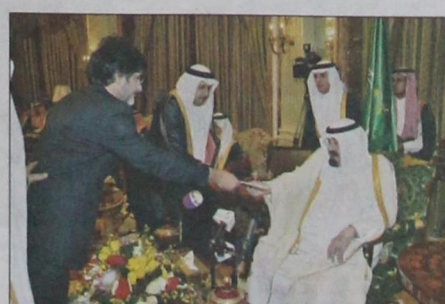
سفير جمهورية البوسنة يقدم أوراق اعتماده