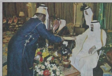
سفير جمهورية القمر يسلم أوراق اعتماده