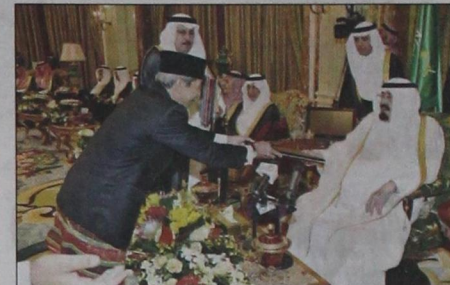
الملك يتسلم أوراق اعتماد السفير الاتونيسي