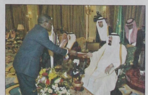
الملك يتسلم أوراق اعتماد سفير جامايكا