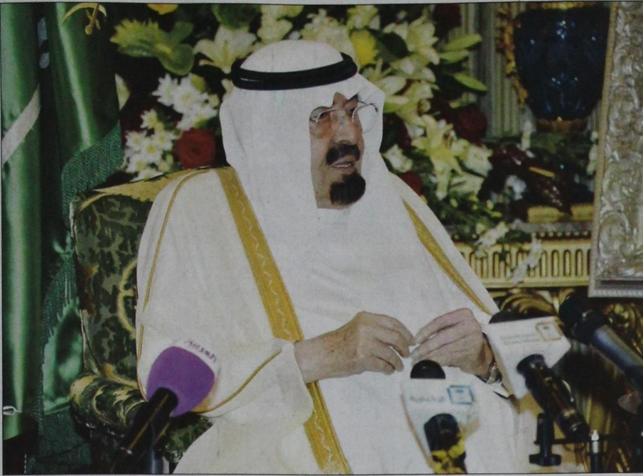
خادم الحرمين مخاطباً السفراء المعيّنين لدى الملكة