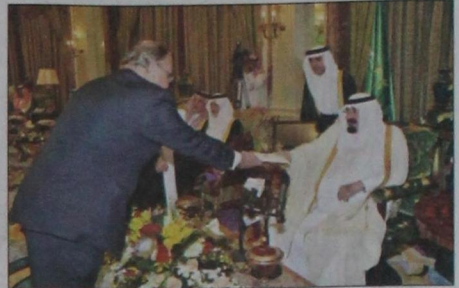
السفير الإسباني لدى تسليمه أوراق اعتماده