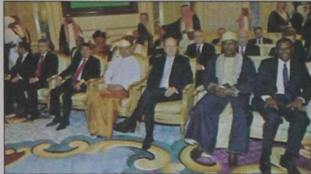
السفراء المعينون يستمعون لكلمة خادم الحرمين الشريفين

بسيطة حولنا تجعلنا نحمد الله على نعمة الأمن والأمان والاستقرار التي نعيشها هنا في المملكة تحت قيادتك الرشيدة فبينما يضرب العنف والإرهاب وتسيل الدماء في المدن والعواصم التي حولنا، تقام الجسور وتبنى الأبراج وتعمر الصحراء وتعد الطرق وتشيد المصانع وتؤسس البنية التحتية في المملكة العربية السعودية". وأردف يقول "إن القيادة الحكيمة تصنع الفرق، وقد توصلت أنا وزملائي السفراء إلى أن قيادتكم الرشيدة