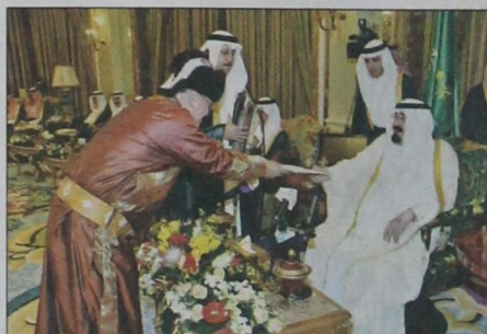
سفير منغوليا يسلم أوراق اعتماده