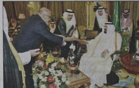
سفير جمهورية سيرلانكا يقدم أوراق اعتماده (و.أ.س)

الشرين وصاحب السمو الأمير فهد بن عبدالله بن محمد رئيس هيئة الطيران المدني وصاحب السمو الملكي الأمير خالد بن بندر بن عبدالعزيز رئيس الاستخبارات العامة وصاحب السمو الملكي الأمير الدكتور منصور بن متعب بن عبدالعزيز وزير الشؤون البلدية والقروية وصاحب السمو الأمير تركي بن عبدالله بن محمد مستشار خادم الحرمين الشريفين وصاحب السمو الملكي الأمير محمد بن نايف بن عبدالعزيز وزير الداخلية وصاحب السمو الملكي الأمير عبدالعزيز بن عبدالله بن عبدالعزيز نائب وزير الخارجية وصاحب السمو الملكي الأمير منصور بن ناصر بن عبدالعزيز مستشار خادم الحرمين الشريفين وصاحب السمو الملكي الأمير مشعل بن عبدالله بن عبدالعزيز أمير منطقة مكة المكرمة وصاحب السمو الأمير فواز بن ناصر بن فرحان وصاحب السمو الملكي الأمير تركي بن عبدالله بن عبدالعزيز أمير منطقة الرياض وصاحب السمو الملكي الأمير منصور بن عبدالله بن عبدالعزيز وأصحاب المعالي الوزراء ومعالي رئيس