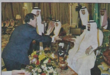
الملك يتسلم أوراق اعتماد سفير جمهورية البرتغال (و.ا.س)