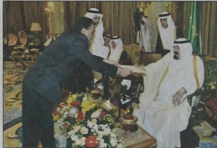
سفير جمهورية موريشوس يسلم أوراق اعتماده