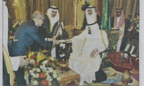
سفير جمهورية مالطا يقدم أوراق اعتماده (و.ا.س)

قد جعلت من المملكة العربية السعودية واحة أمان ، إن حكمتكم يا خادم الحرمين الشريفين ، مع ما يتمتع به بلدكم من نقل سياسي واقتصادي ، قد لفتت كثيرا من التورات خارج حدود المملكة ، أما كرمكم فقد أشبع بطونا جائعة وأمن نفوسا حائرة وعالج أجسادا عليلة وطمان جاليات خائفة وتابع " نحن السفراء لا نتكلم عن الماديات فقط ، حيث إن جهودكم الروحانية لا ينكرها إلا جاحد ، فما التوسعات في الحرمين الشريفين إلا دليل على خدمة