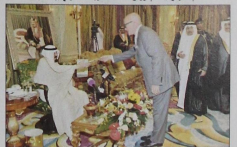
خادم الحرمين يتسلم أوراق اعتماد سفير المملكة المتحدة جون جيكنز