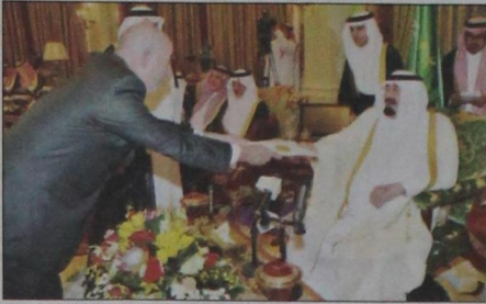
سفير جمهورية كوبا يسلم أوراق اعتماده (و.ا.س)