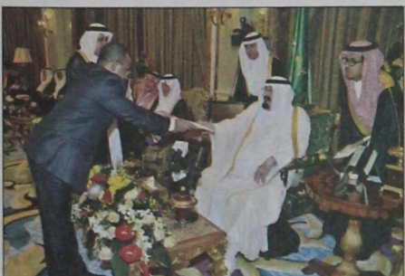
ديك باتريك يسلم أوراق اعتماده سفيراً لجمهورية سيشل (و.ا.س)