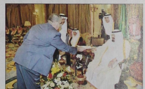
خادم الحرمين يتسلم أوراق اعتماد السفير الفلسطيني