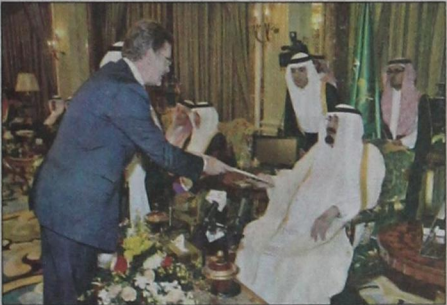
سفير جمهورية ليتوانيا يسلم أوراق اعتماده