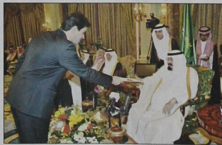
خادم الحرمين يتسلم أوراق اعتماد السفير الليبي (و.ا.س.)