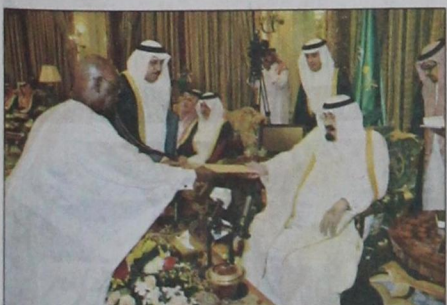
سفير جمهورية السنغال يقدم أوراق اعتماده