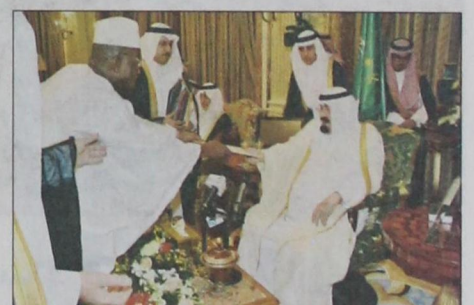
سفير جمهورية سيراليون يقدم أوراق اعتماده (و.ا.س)