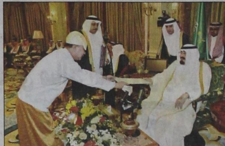
سفير جمهورية ميانمار يسلم أوراق اعتماده