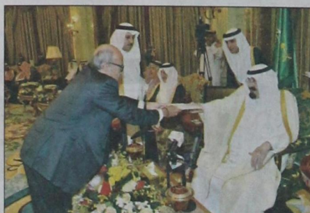
الملك يتسلم أوراق اعتماد سفير نيكاراغوا (و.ا.س)