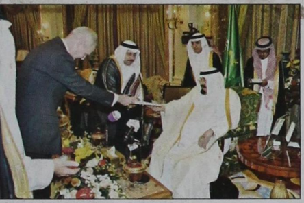
سفير ألمانيا الاتحادية يسلم أوراق اعتماده (و.ا.س.)