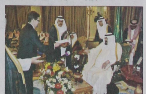
سفير فنلندا يسلم أوراق اعتماده