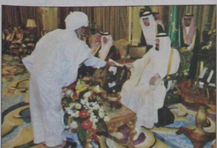
سفير جمهورية موريتانيا يسلم أوراق اعتماده