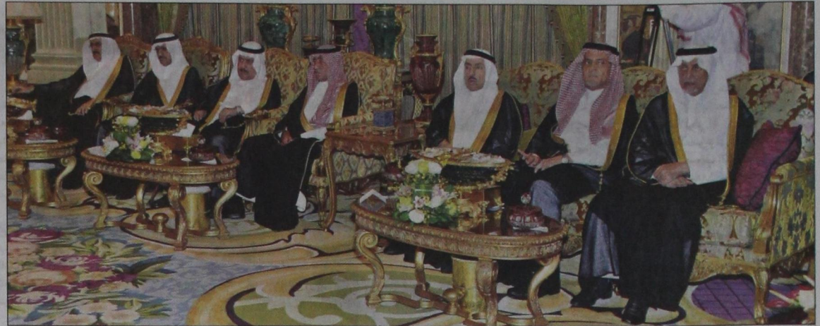
أصحاب السمو الملكي الأمراء خلال حفل استقبال السفراء