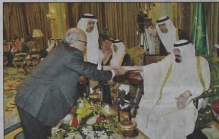
سفير نيكاراغوا يسلم أوراق اعتماده