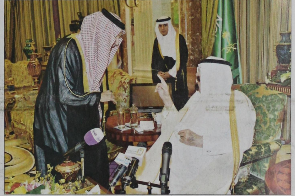
خادم الحرمين في حديث مع سعود الفيصل