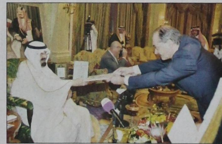
الملك يتسلم أوراق اعتماد سفير جمهورية النمسا (و.ا.س.)