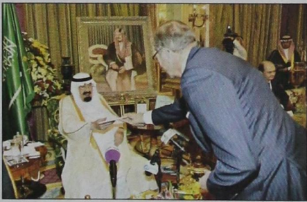
خادم الحرمين يتسلم من سفير هولندا أوراق اعتماده (و.ا.س.)