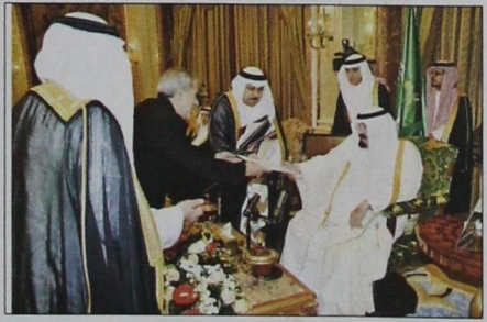
سفير جمهورية إيران يسلم أوراق اعتماده