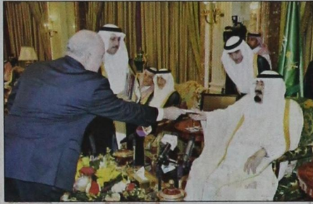
الملك يتسلم أوراق اعتماد سفير الولايات المتحدة