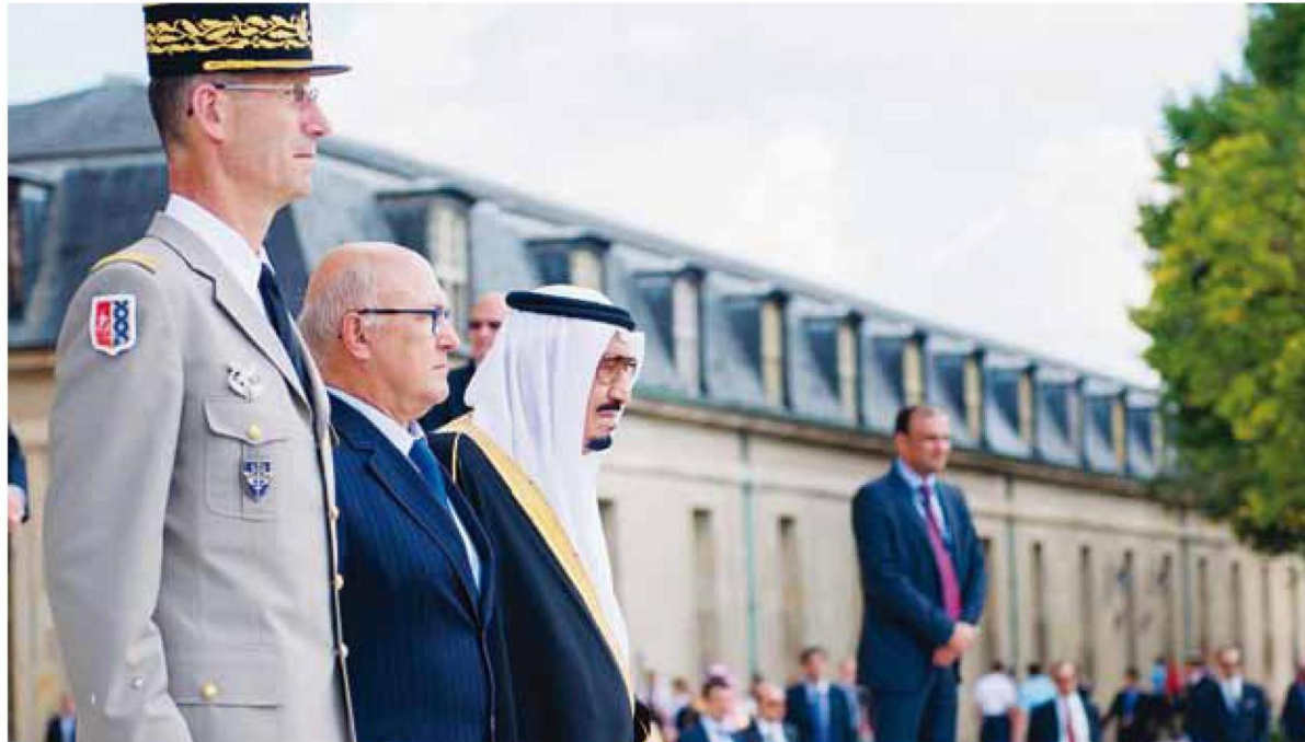
<< سموه يستعرض حرس الشرف

وكان -حفظه الله- وصل إلى باريس أمس، في بدء زيارة رسمية بدعوة من الرئيس فرانسوا هولاند رئيس الجمهورية الفرنسية، ولدى وصول سموه مطار أورلي كان في استقباله عند سلم الطائرة الأمير سعود الفيصل وزير الخارجية، والسفير الفرنسي لدى المملكة بيرتران بيزانسون، وممثل البروتوكول بوزارة الخارجية الفرنسية جيرى، ثم توجه سمو ولي العهد إلى صالة التشریفات، حيث كان في استقباله الأمير محمد بن فهد بن عبدالعزيز، والأمير مشعل بن ماجد بن عبدالعزيز محافظ جدة، والأمير منصور بن ثنيان بن محمد، والأمير خالد بن سعد بن فهد، والأمير محمد بن سعود بن خالد وكيل وزارة الخارجية لشؤون المعلومات والتقنية، والأمير بندر بن