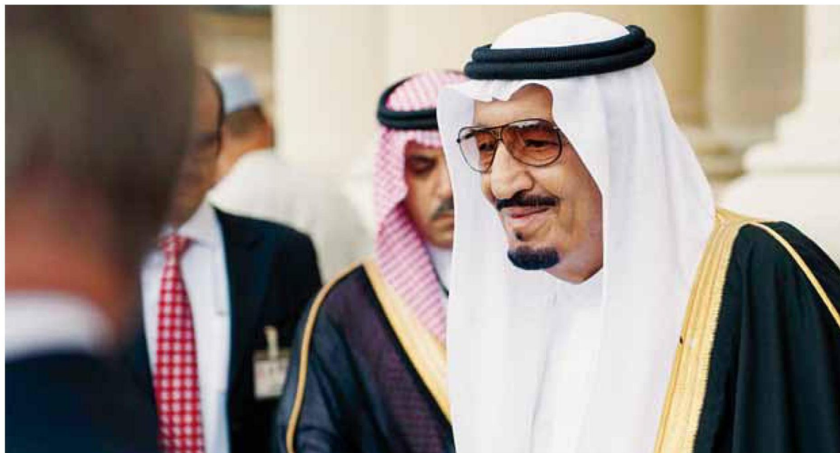
<< ولي العهد يصفح كبار المسؤولين