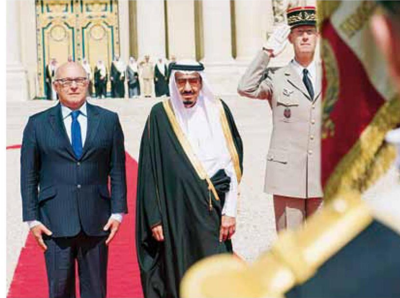
<< ولي العهد لدى وصوله إلى فرنسا