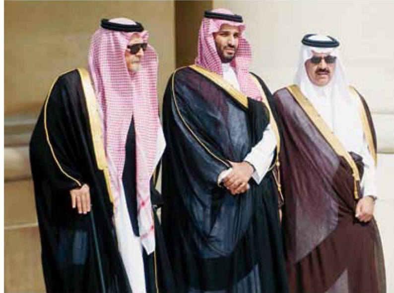
<< الأميران سعود الفيصل ومحمد بن سلمان ود. العيبان

التاريخ: 2014-09-02 رقم العدد: 15054 رقم الصفحة: 2 مسلسل: 5 رقم القصة: 3