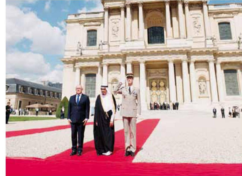
<< الأمير سلمان في ساحة انفاليد