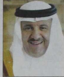
الأمير سلطان بن سلمان

وشدد سموه على أن وجود جدة التاريخية ضمن التراث العالمي، يحتاج منا مسؤوليات مضاعفة، وليس فقط للمحافظة عليه، وإنما لتعزيزه بالعديد من القيم. وعذ سمو محافظ جدة التاجح الرائع الذي تحقق في مهرجان جدة التاريخية العام الماضي بأنه نتاج طبيعي ومباشر لجهود كبيرة بداية من دعم لا محدود من قائد المسيرة المباركة خادم الحرمين الشريفين الملك عبدالله بن عبدالعزيز آل سعود وسمو ولي عهده الأمين وسمو ولي العهد -أيدهم الله- وبعمل مخلص لم يتوقف لحظة من الملاك والأهالي في منظومة متكاملة توجت بهذا الانجاز الذي يعتز به