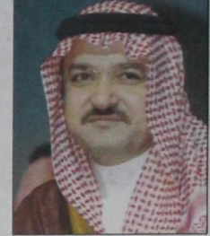
الأمير مشعل بن ماجد

من قبل صيادي أسماك في البحر الأحمر وكانوا يعتبرون جدة مركزاً لانطلاقهم للبحر ومقصد الراحته. لكن بعض الروايات تشير إلى أن تاريخ جدة يعود إلى ما قبل الإسكندر الأكبر الذي زارها. ودعا صاحب السمو الملكي الأمير مشعل بن ماجد محافظ جدة رئيس اللجنة العليا لمهرجان جدة التاريخية المواطنين وزوار مدينة جدة وكل من يفد إليها أن يتوجه إلى هذه المنطقة المليئة بكنوز التراث الجميل بكل ما فيه من تجليات وتطلعات مجيبة أن جدة تاريخ يستحق أن يشاهده كل المهتمين والباحثين ومن له حب لهذه المدينة الجميلة.