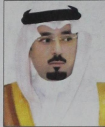
الأمير مشعل بن عبدالله

كل مواطن على هذه الأرض الطيبة. واكد سمو الامير مشعل بن ماجد على ان الدور الأهم على الأهل والملاك في ترميم وإحياء هذه المساكن القيمة، والداومة على صيانتها والاهتمام بها والحرص على أن تكون في أبهى صورة بما يتكامل مع الجهود الحكومية في هذا الشأن، إسهما في الإبقاء على هذه الكنوز التي سنؤدي نقلة اجتماعية واقتصادية مع تقديم الخدمات التي تتوافق مع متطلبات العصر الحديث من دون المساس من قريب أو بعيد بسمات هذه الصورة الرائعة من التراث العالمي". ويرى صاحب السمو الملكي الأمير سلطان بن سلمان بن