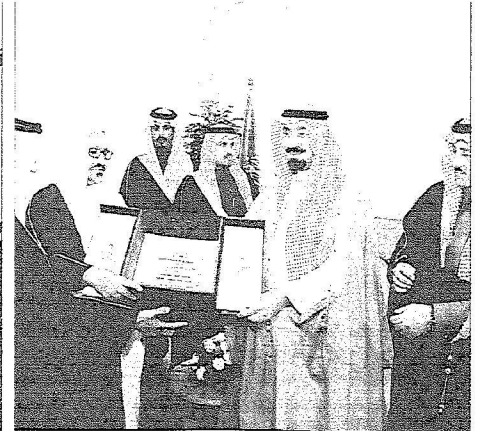
يشكلم درعا تذكارية