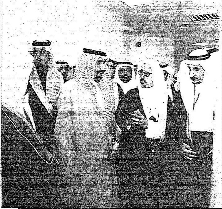
.. ويطالع على بعض الإحصائيات

المصدر : اليوم التاريخ : 25-02-2008 العدد : 12673 الصفحات : 6 المسلسل : 57