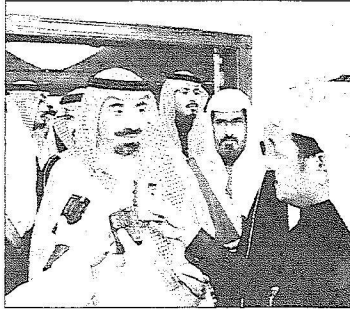
سموه يتحدث إلى ممثلى وسائل الإعلام

امير المنطقة الشرقية لاقامة المبنى. واشار ال علي الى ان بدء الافتتاح يتزامن مع بدء العمل فى فرع الصيانة فى الاحساء وجدة ويعكس اهتمام الدولة بزيادة الفروع لتشغل كل المحافظات والناطق. بعد ذلك تسلم سموه من رئيس الهيئة تقريراً عن انجازات فرع الدمام وهدية تذكارية.