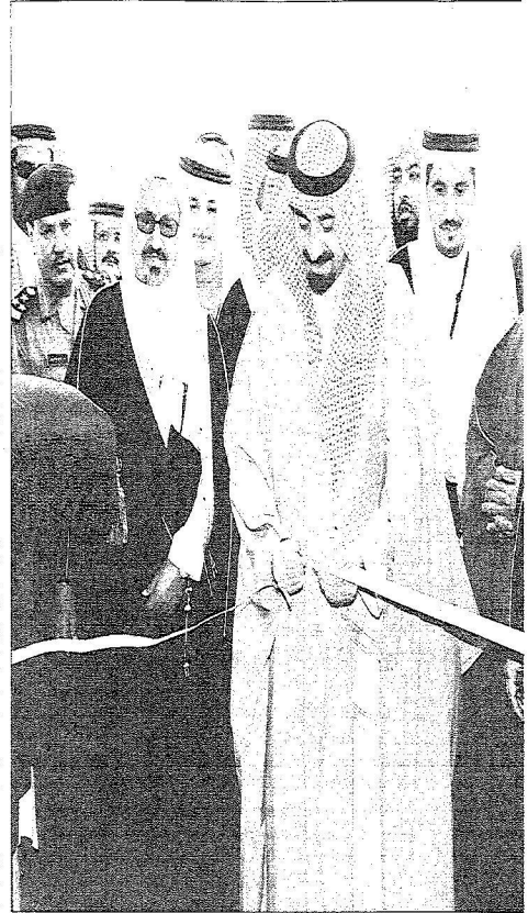
سعود يرضي حفرة افتتاح البيت

• مجلس المنطقة يتعاون مع الهيئة ويتابع قضاياها • آل علي : مبنيان حكوميان جديان بالأحساء وجدة