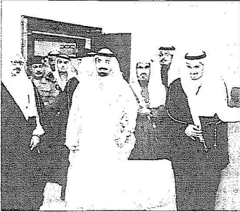
ويتجول في أرجاء المبنى

امير المنطقة الشرقية لاقامة المبنى. واشار ال علي الى ان بدء الافتتاح يتزامن مع بدء العمل فى فرع الصيانة فى الاحساء وجدة ويعكس اهتمام الدولة بزيادة الفروع لتشغل كل المحافظات والناطق. بعد ذلك تسلم سموه من رئيس الهيئة تقريراً عن انجازات فرع الدمام وهدية تذكارية.