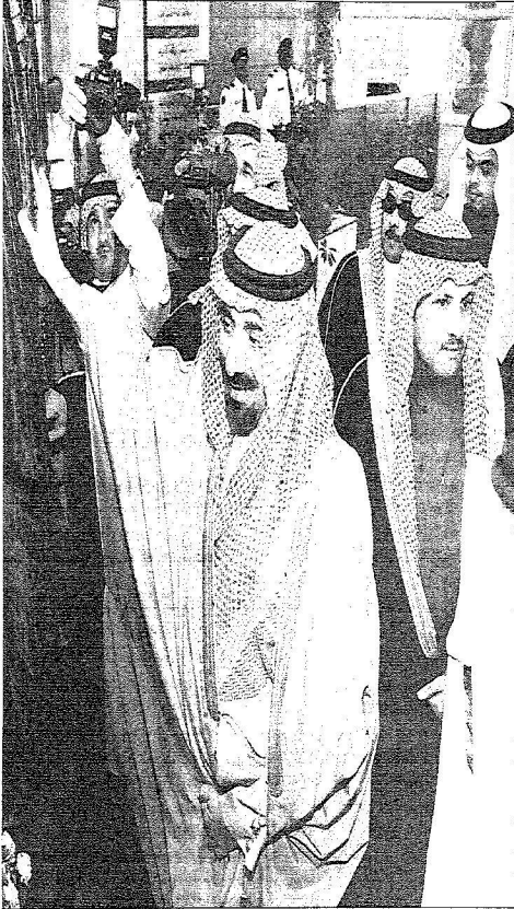
وزير المعارف عن الوحدة التذكارية