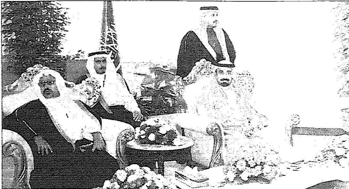
الأمير جلوي بن عبد العزيز في منصة الحفل