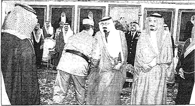
سلطنة عمان الأستاذ عبد الله بن عبدالرحمن عالم، حفظ الله خادم الحرمين الشريفين في سفره وإقامته.