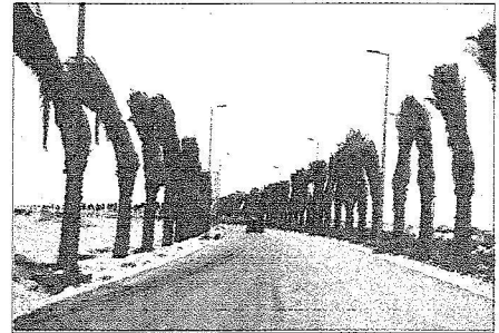
اشجار النخيل على امتداد الطريق المؤدي للمدينة الاقتصادية