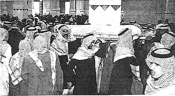
جثمان أحد الشهداء محمولا على الاعتناق

وفي عترة أدي سمو الأمير فيصل بن بندر، وسمو الأمير محمد بن نايف الصلاة على شهداء الواجب عملا لله المطيري، عبید الطيبري وسعد الداموك في جامع الشيخ ابن عثيمين بالمحافظة.