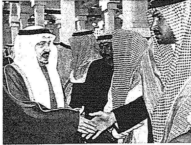
امير القصيم يعزي أسرة الرشيدى

وعقب الصلاة قدم سمو الأمير فيصل بن بندر والأمير محمد بن نايف تعازي القيادة الرشيدة لأسرة الشهيدين. وأوضح سموه أن مسيرة البلاد واضحة منذ مائة عام، ونحن لا ننظر لمن يشكك في شيء لأن الشعب ليست بيته والقيادة حولجب، ويستطيع أي فرد ابداء رأيه وقال سموه أن أبناء المنطقة رجال ولله الحمد يعرفون واجباتهم ويقدمون التضحيات ومن أستشهدوا بالامس هم جزء من أبناء المملكة ومنطقة القصيم، وهو رد واضح لمن يحاول التشكيك في ولاء أبناء المنطقة.