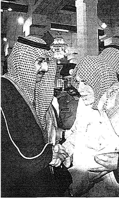
والأمير محمد بن نايف يعزي والد العريف القصبي