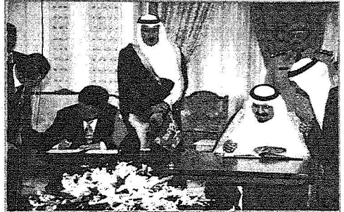
سمو ولي العهد ودولة نائب الرئيس الصيني يوقعان البيان المشترك

الأمير سلطان: الصين شريك مهم وفعال وبتطلع إلى مستقبل مشرق